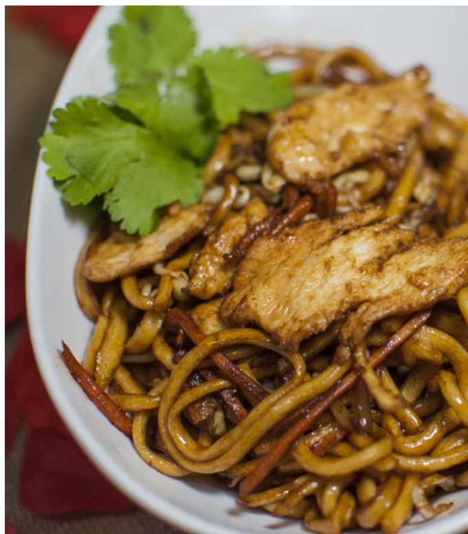
14.11. ЖАРЕНАЯ ЛАПША С КУРИЦЕЙ