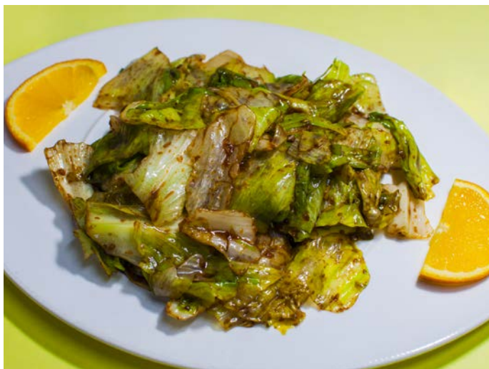
3.11. ЖАРЕНый ЗЕЛЕНый САЛАТ В УСТРИЧНОМ СОУСЕ 耗油生菜