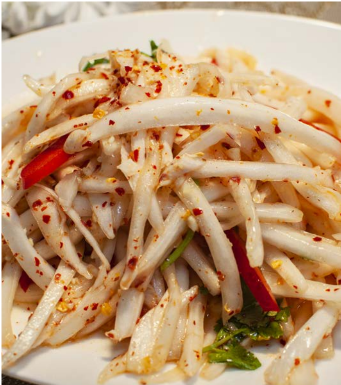
1.2. КИТАЙСКАЯ КАПУСТА В КИСЛО-ОСТРОМ СОУСЕ 酸辣白菜丝