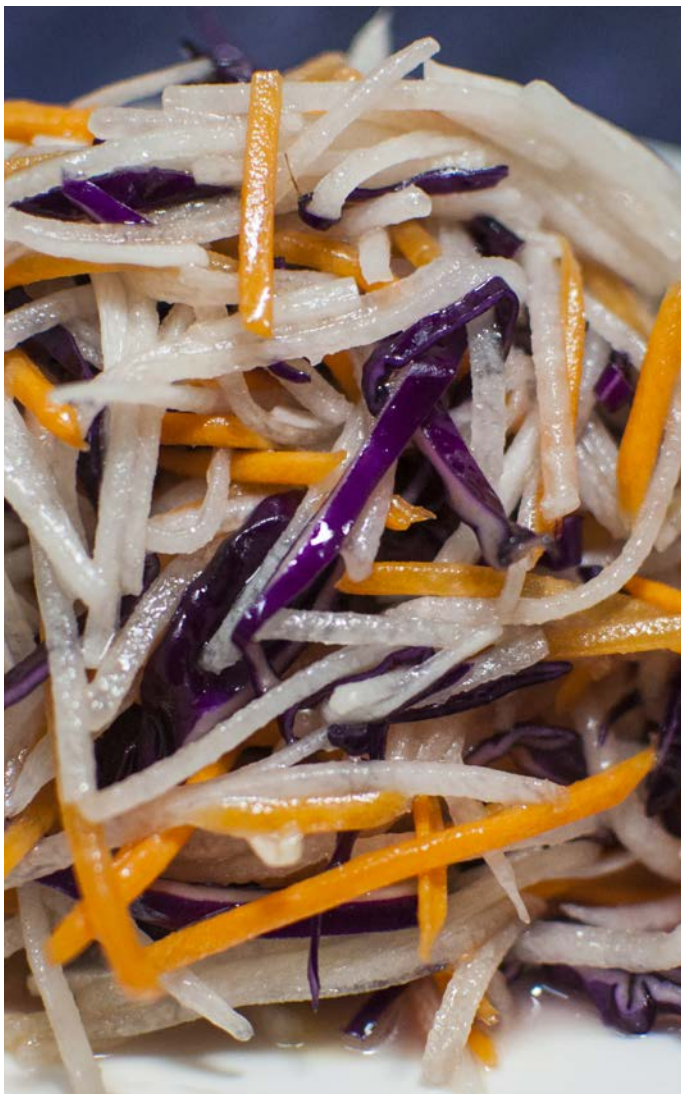
1.29. САЛАТ ИЗ КРАСНОКОЧАННОЙ КАПУСТЫ С ДАЙКОНОМ И МОРКОВЬЮ 200 г 347₽ 美味三丝