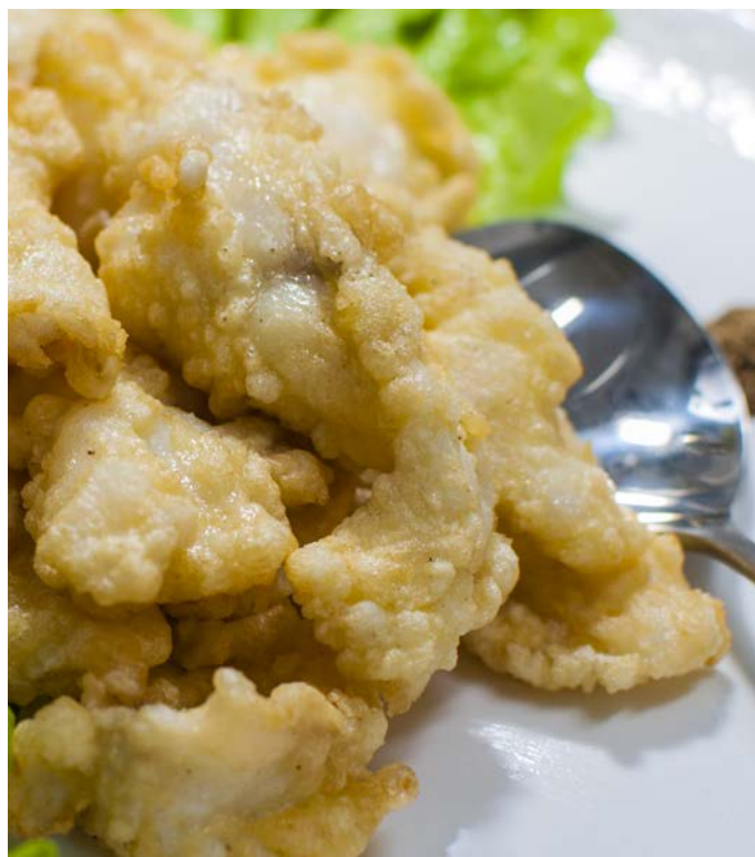
7.16. ФИЛЕ СУДАКА В ПРЯНОМ КЛЯРЕ 软炸鱼