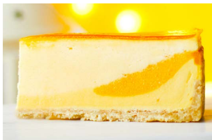
ЧИЗКЕЙК МАНГО С МАРАКУЙЕЙ 芒果-百香果芝士