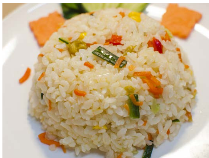
13.4. ЖАРЕНый РИС С ОВОЩАМИ 扬州炒饭