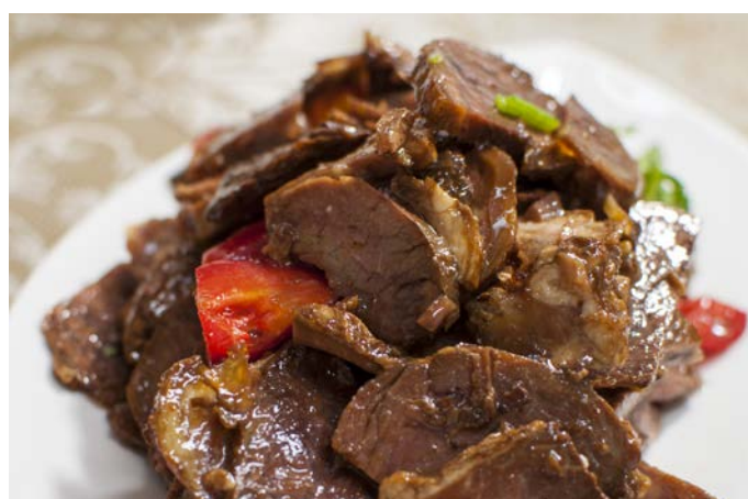
1.17. НАРЕЗКА ИЗ ГОВЯДИНЫ В СОУСЕ ПЯТИ АРОМАТОВ 凉拌牛肉