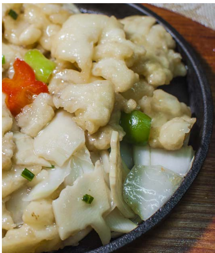
8.4. РЫБНОЕ ФИЛЕ 铁板鱼片