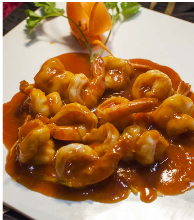
7.5. ХРУСТЯЩИЕ КРЕВЕТКИ 12 штук 727₽ В КИСЛО-СЛАДКОМ СОУСЕ ПО ТРАДИЦИОННОМУ КИТАЙСКОМУ РЕЦЕПТУ 火爆大虾