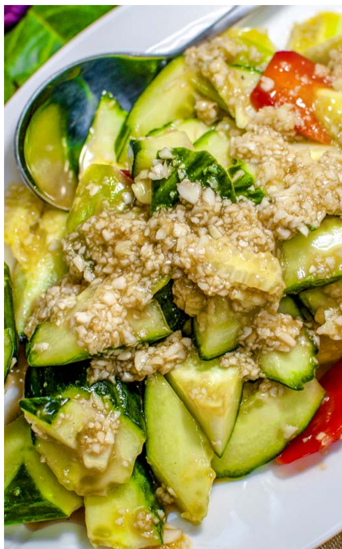
1.19. БИТЫЕ ОГУРЦЫ В ЧЕСНОЧНОМ СОУСЕ 蒜拌黄瓜