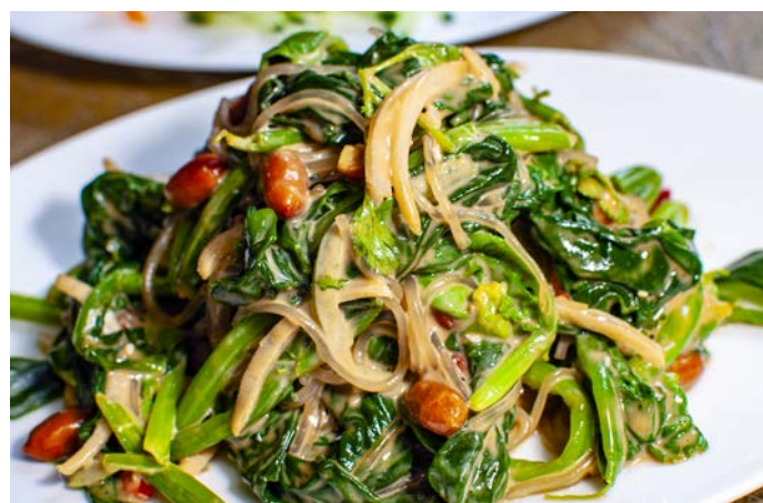
1.24. САЛАТ ИЗ ШПИНАТА С ПРОЗРАЧНОЙ ЛАПШОЙ В КУНЖУТНОМ СОУСЕ