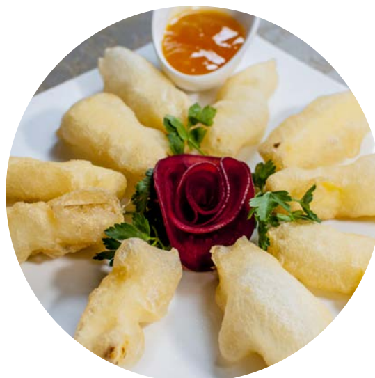
16.8. ЖАРЕНОЕ МОЛОКО