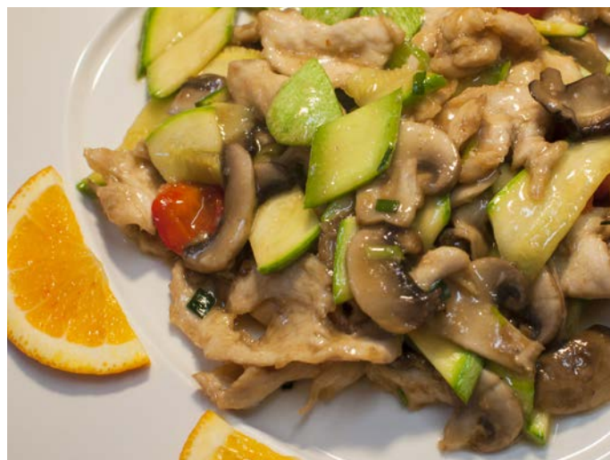
5.4. ЖАРЕНОЕ КУРИНОЕ ФИЛЕ С ГРИБАМИ «СЯНГУ» 香菇鸡片