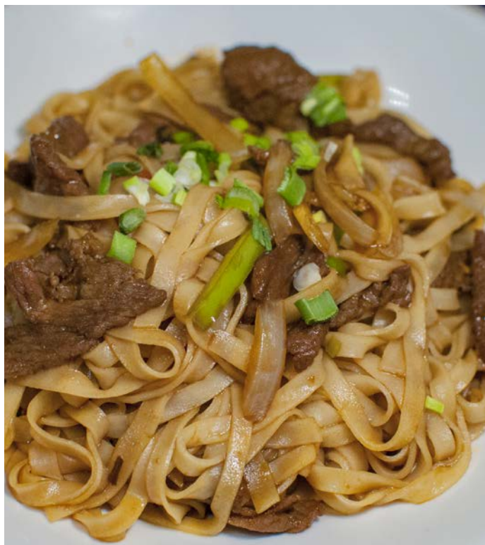
14.12. ЖАРЕНАЯ РИСОВАЯ ЛАПША С ГОВЯДИНОЙ