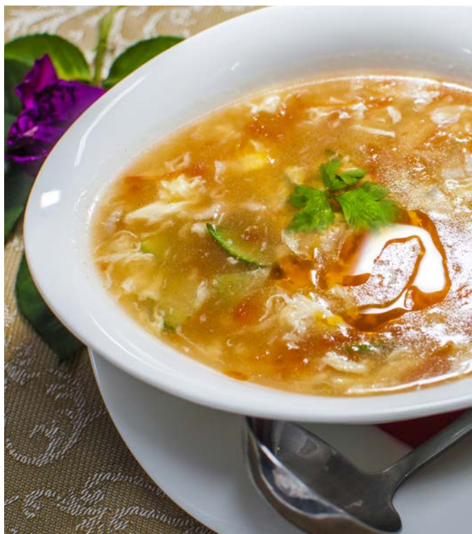
2.2. КИСЛО-ОСТРЫЙ СУП СО СВИНИНОЙ