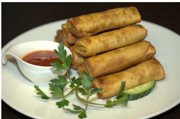
15.8. КИТАЙСКИЕ ХРУСТЯЩИЕ БЛИНЧИКИ С КАПУСТОЙ И ЯЙЦОМ 炸春卷 素馅