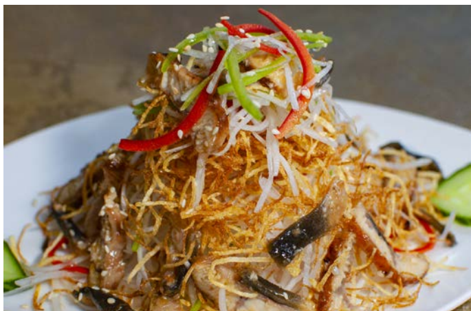
1.6. САЛАТ С КОПЧЕНЫМ УГРЕМ И ОВОЩАМИ