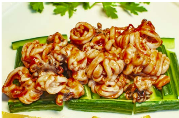
7.7. КАРАКАТИЦЫ ПО-ХАЙНАНЬСКИ