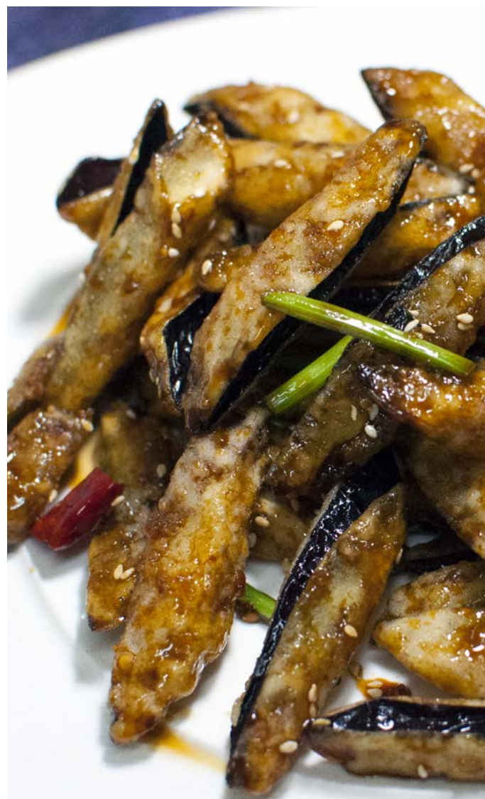
3.4. ХРУСТЯЩИЕ БАКЛАЖАНЫ В КАРАМЕЛЬНОМ СОУСЕ