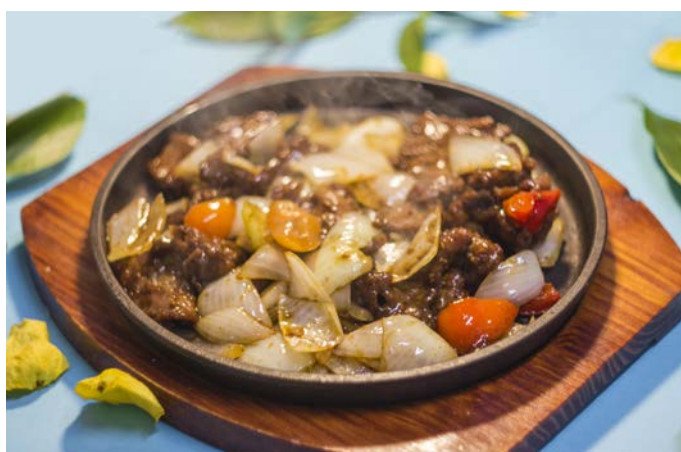
8.12. ФИЛЕ ГОВЯДИНЫ С ЧЕРНЫМ ПЕРЦЕМ