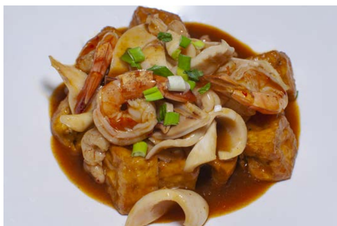
9.6. ТОФУ С КРЕВЕТКАМИ И КАЛЬМАРАМИ В ОСТРОМ СОУСЕ