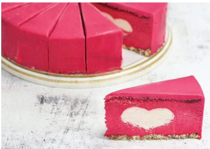
ТОРТ "МАЛИНОВАЯ ПАННА КОТТА" 浆果蛋糕