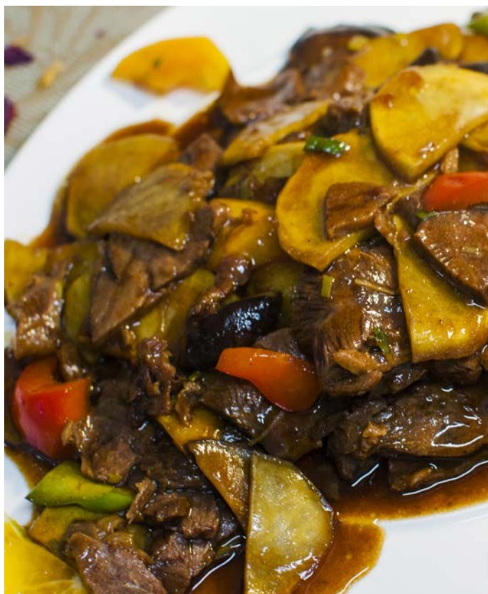
6.2. ТУШЕНАЯ ГОВЯДИНА С КАРТОФЕЛЕМ 土豆牛肉