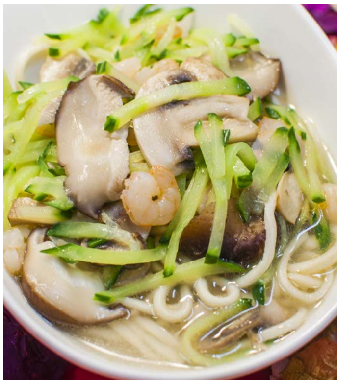
14.6. ЛАПША С КРЕВЕТКАМИ В БУЛЬОНЕ 虾仁汤面