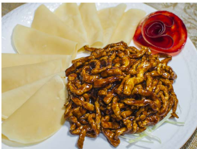
4.3. СВИНИНА В СЛАДКО-СОЕВОМ СОУСЕ С БЛИНЧИКАМИ 京酱肉丝卷饼