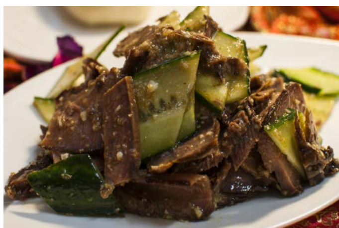
1.13. НАРЕЗКА ИЗ СВИНОГО ЯЗЫКА В ЧЕСНОЧНОМ СОУСЕ 蒜香口条