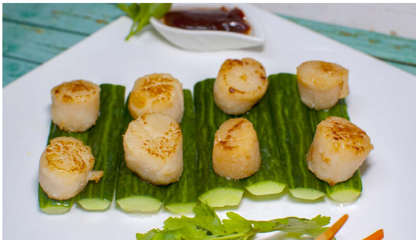
7.21. ГРЕБЕШОК МОРСКОЙ В ЧЕСНОЧНОМ СОУСЕ 蒜香瑶柱