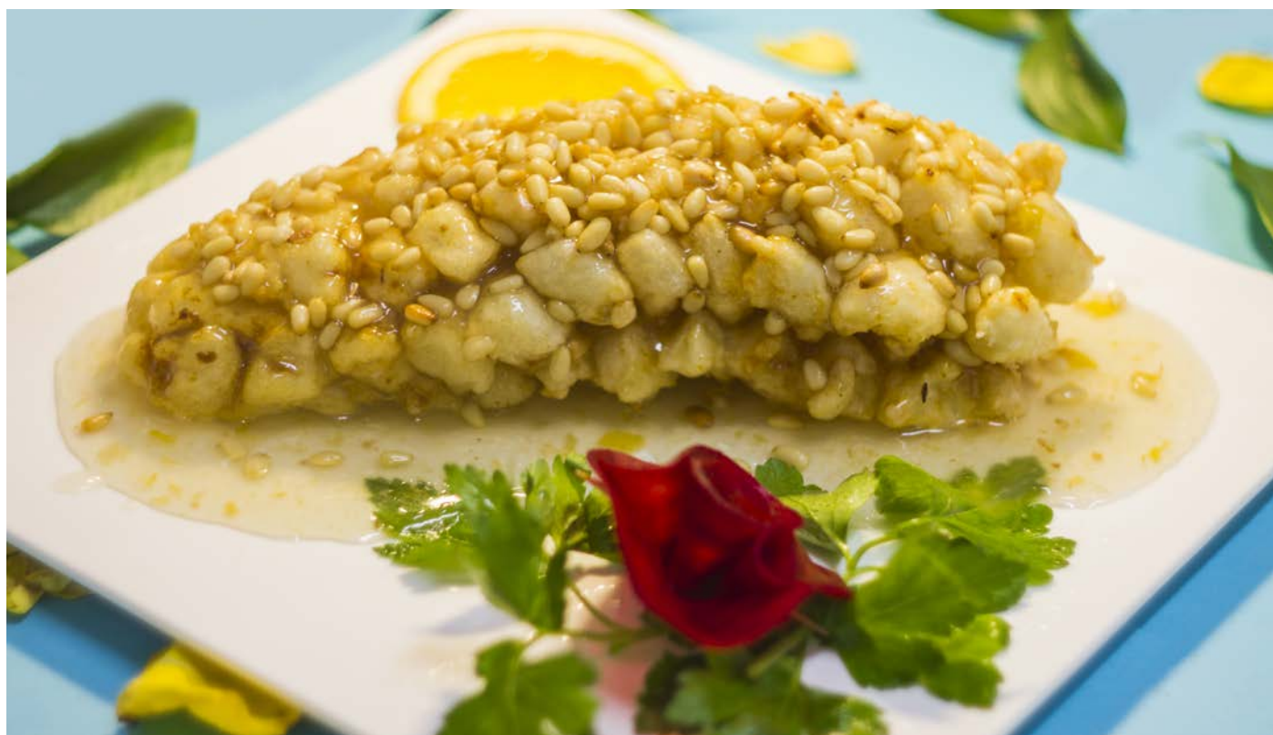
7.19. СУДАК ПО-ХАЙНАНЬСКИ 松鼠鱼