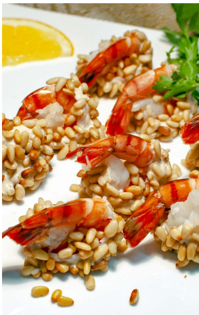
7.8. КОРОЛЕВСКИЕ КРЕВЕТКИ В ШУБКЕ ИЗ КЕДРОВЫХ ОРЕШКОВ