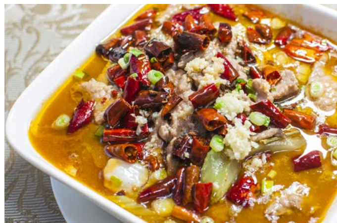
11.6. ОСТРАЯ СВИНИНА В БУЛЬОНЕ С ЗЕЛЕНЫМ ЛУКОМ 500 г 517₽ 川江水煮肉