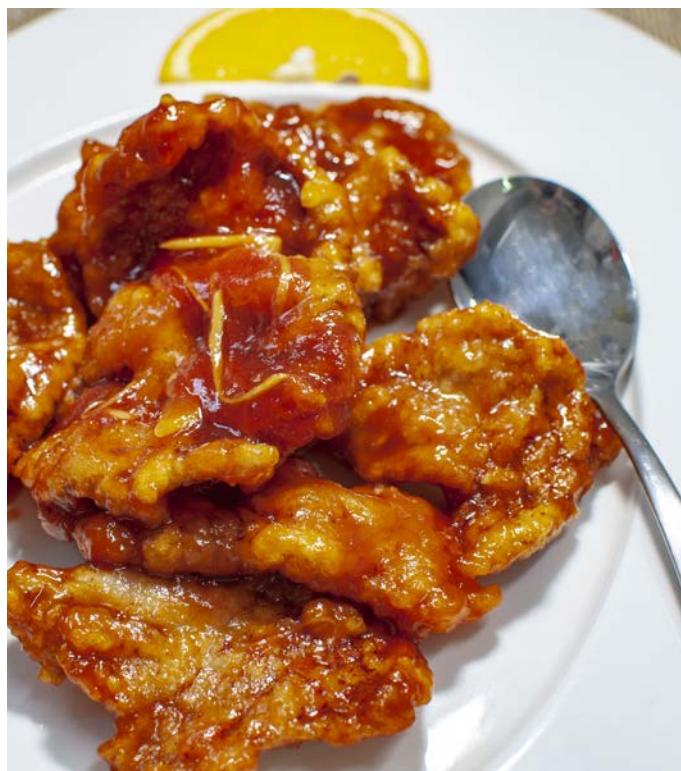
4.11. ХРУСТЯЩАЯ СВИНИНА В КИСЛО-СЛАДКОМ СОУСЕ 锅包肉