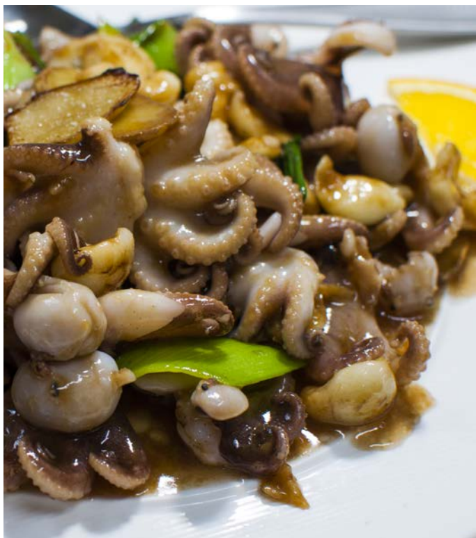
7.11. МАЛЕНЬКИЕ ОСЬМИНОЖКИ В ЧЕСНОЧНОМ СОУСЕ