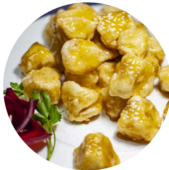
16.4 МАНДАРИНЫ В КАРАМЕЛИ