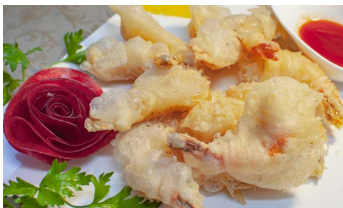
7.9. КОРОЛЕВСКИЕ КРЕВЕТКИ В КЛЯРЕ (ПОДАЮТСЯ С КИСЛО- СЛАДКИМ СОУСОМ)