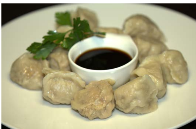
15.7. КИТАЙСКИЕ ПЕЛЬМЕНИ С ОВОЩАМИ И ГРИБАМИ 蘑菇水饺