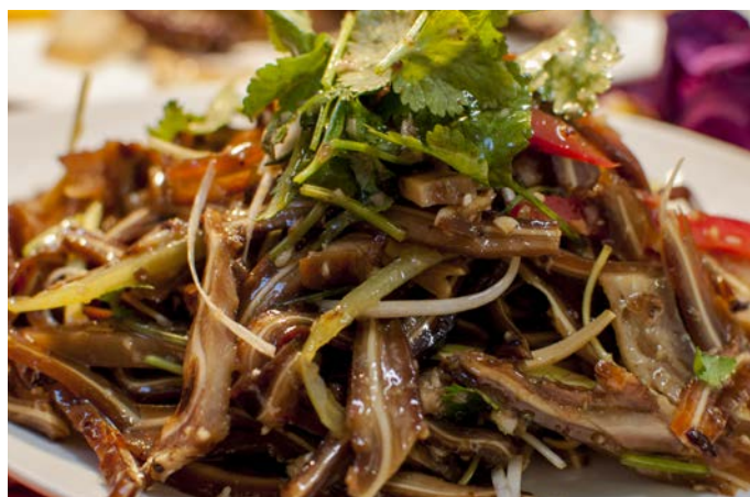
1.12. САЛАТ ИЗ СВИНЫХ УШЕК 凉拌耳丝