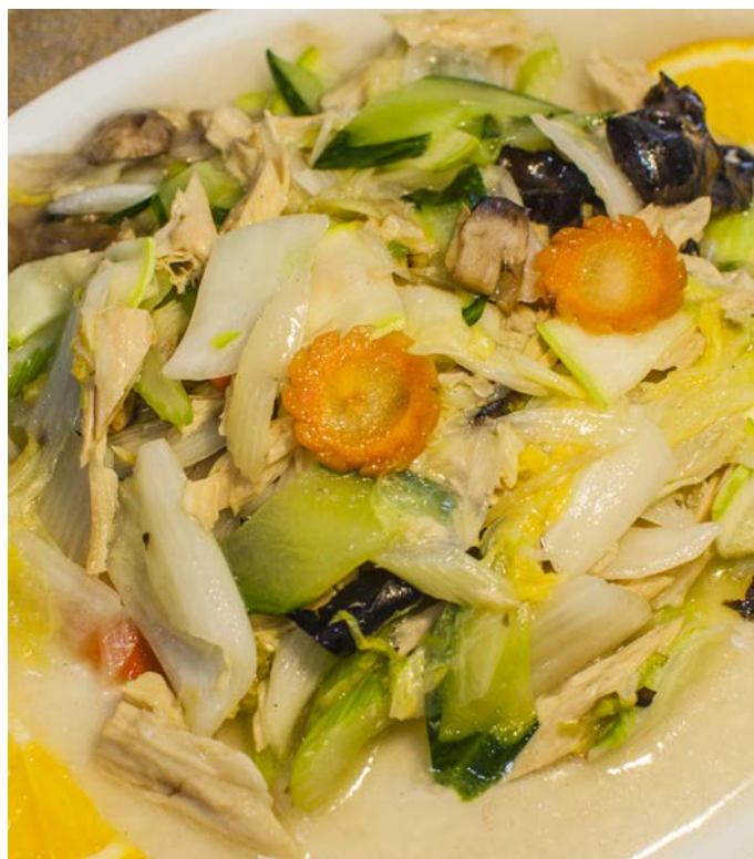
3.7. ЖАРЕНОЕ АССОРТИ ИЗ ОВОЩЕЙ 蔬菜什锦