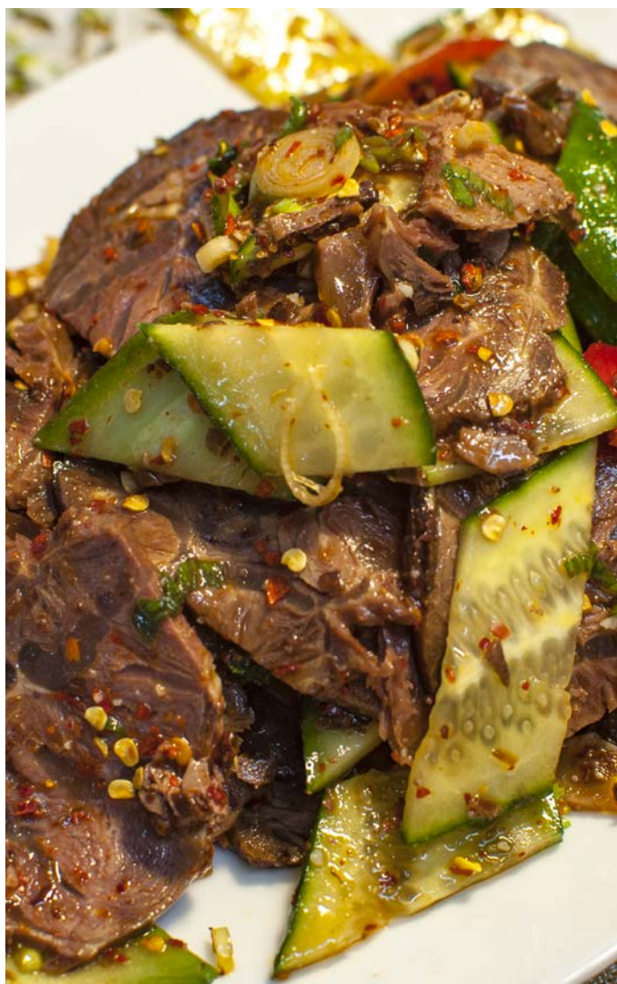
1.11. НАРЕЗКА ИЗ ГОВЯДИНЫ В ОСТРОМ СОУСЕ 麻辣牛肉