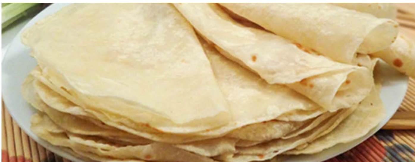
КИТАЙСКИЕ ПАРОВЫЕ БЛИНЧИКИ (ЛАВАШ) 10 ШТ. 小卷饼