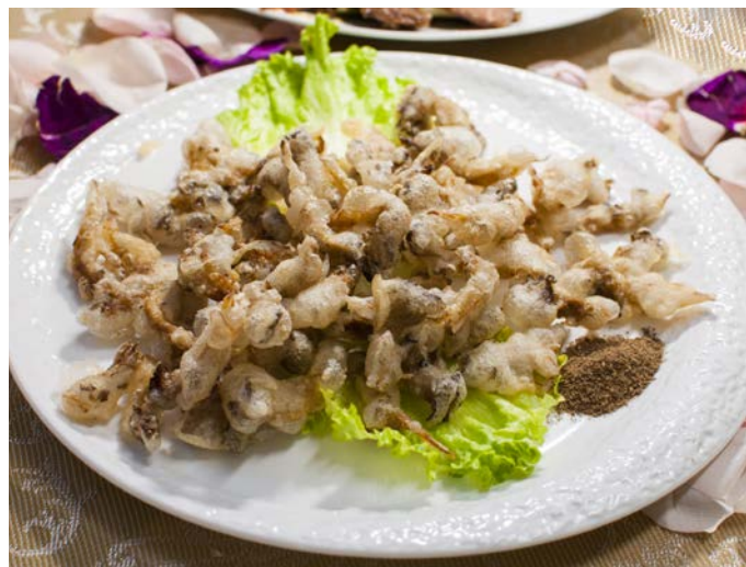
3.12. ГРИБЫ ВЕШЕНКИ ОБЖАРЕННЫЕ В КЛЯРЕ 干炸蘑菇