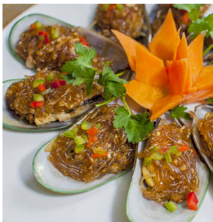
7.3. МИДИИ В ЧЕСНОЧНОМ СОУСЕ 8 штук 527₽ С ПРОЗРАЧНОЙ ЛАПШОЙ 蒜蓉清口