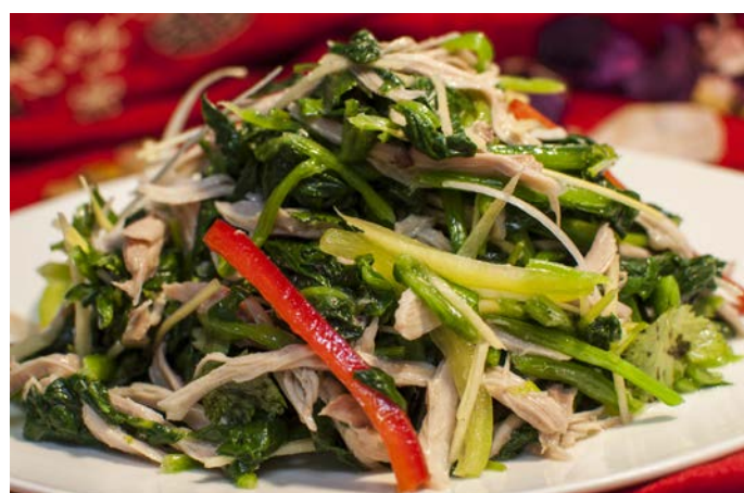
1.9. САЛАТ ИЗ КУРИНОГО ФИЛЕ СО ШПИНАТОМ