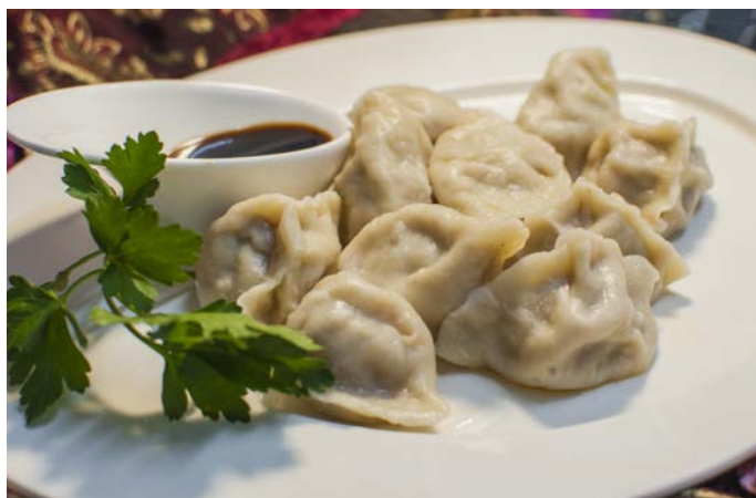
15.3. КИТАЙСКИЕ ПЕЛЬМЕНИ СО СВИНИНОЙ 猪肉水饺