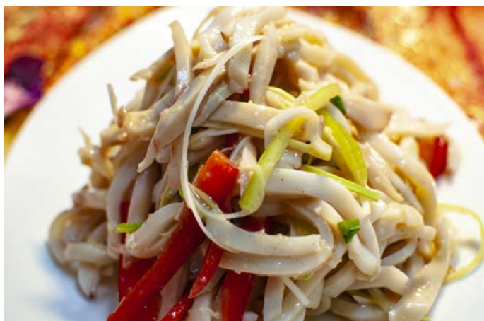
1.16. САЛАТ ИЗ КАЛЬМАРОВ С БОЛГАРСКИМ ПЕРЦЕМ 凉拌鱿鱼丝