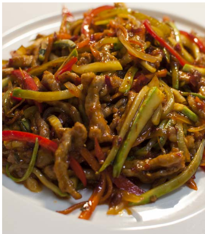
4.6. ЖАРЕНАЯ СВИНАЯ СОЛОМКА В СЛАДКО-ОСТРОМ СОУСЕ С ОВОЩАМИ