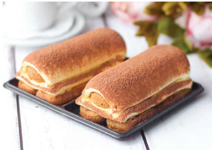
ТИРАМИСУ МАСКАРПОНЕ 提拉米苏