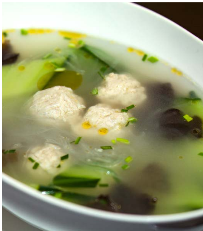
2.3. СУП СО СВИНЫМИ ФРИКАДЕЛЬКАМИ И ПРОЗРАЧНОЙ ЛАПШОЙ