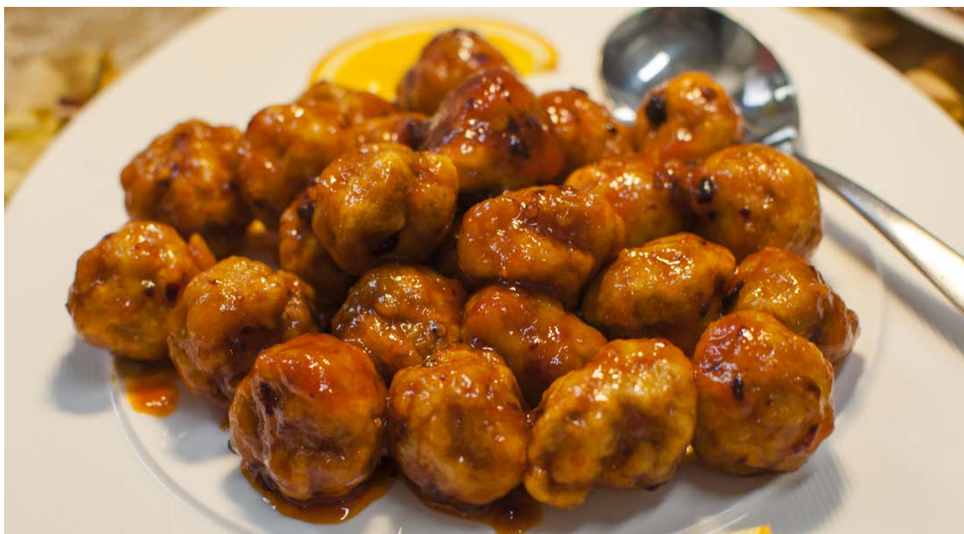
4.7. ЖАРЕННЫЕ СВИНЫЕ ФРИКАДЕЛЬКИ В СЛАДКО-ОСТРОМ СОУСЕ