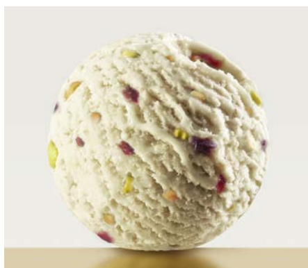
СОСНОВЫЕ ШИШКИ 松果味