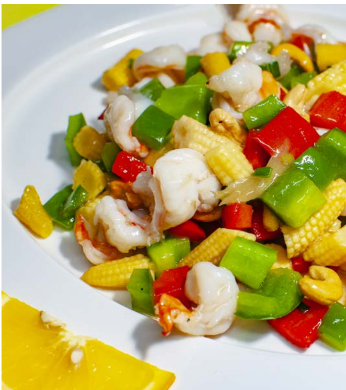
7.4. ЖАРЕННЫЕ КРЕВЕТКИ 200 г 597₽ С ОВОЩАМИ И КЕШЬЮ 腰果虾仁