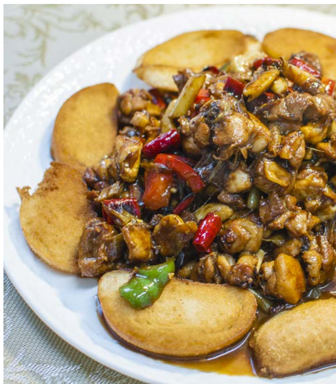
11.11. КУРИЦА В ПРЯНОМ ОСТРОМ СОУСЕ, ПОДАЕТСЯ С ЖАРеныМИ ПАМПУШКАМИ 山鸡泡馍