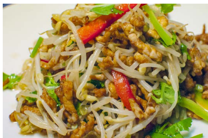
1.10. САЛАТ ИЗ РОСТКОВ СОИ С ЖАРЕНОЙ СВИНОЙ СОЛОМКОЙ