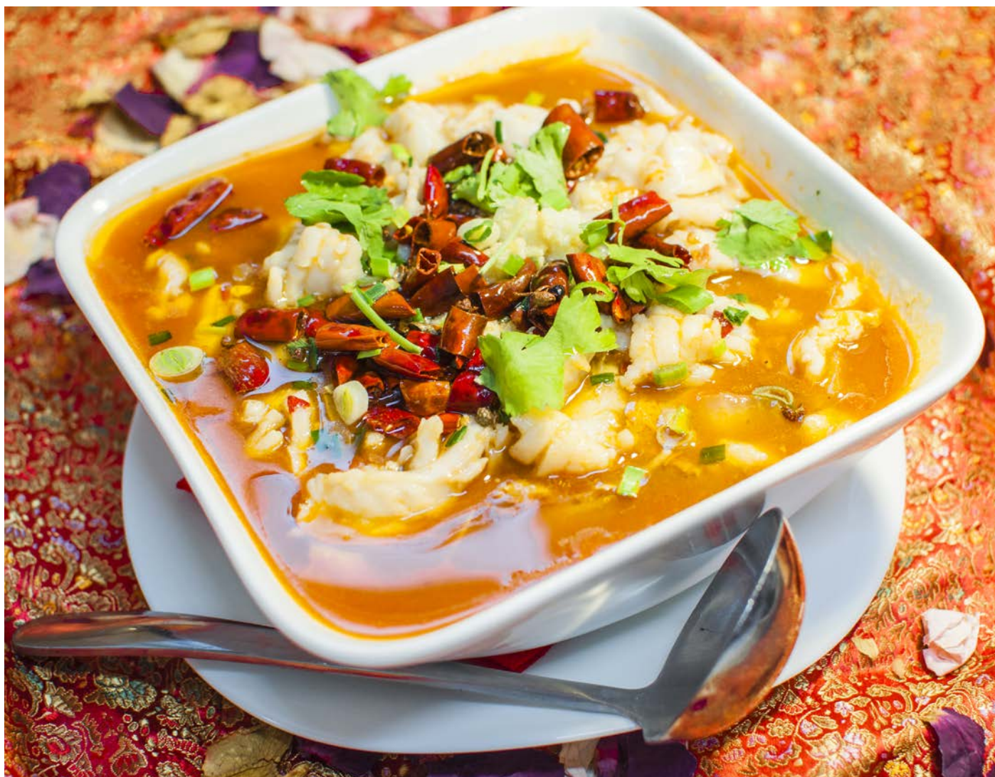
11.2. ОСТРАЯ РЫБА В БУЛЬОНЕ С ЗЕЛЕНЫМ ЛУКОМ 川江水煮鱼