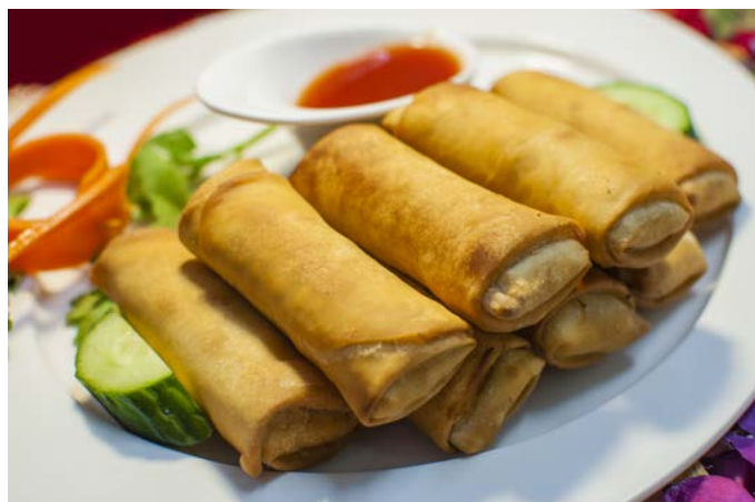
15.9. КИТАЙСКИЕ ХРУСТЯЩИЕ БЛИНЧИКИ СО СВИНИНОЙ 炸春卷 肉馅