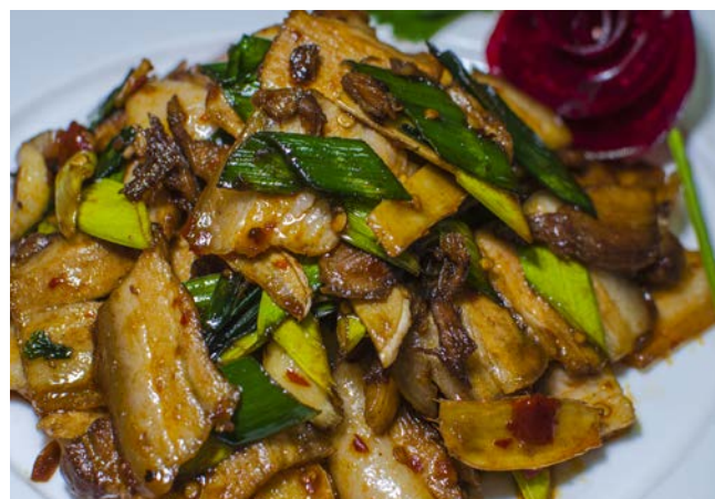
11.9. СВИНОЙ БЕКОН С ОВОЩАМИ В ОСТРОМ СОУСЕ 200 г 467₽ 老转村回锅肉