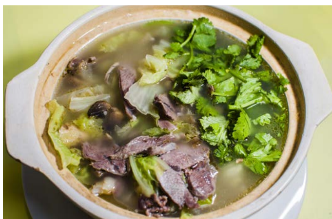
10.3. БАРАНИНА С ОВОЩАМИ И ГРИБАМИ