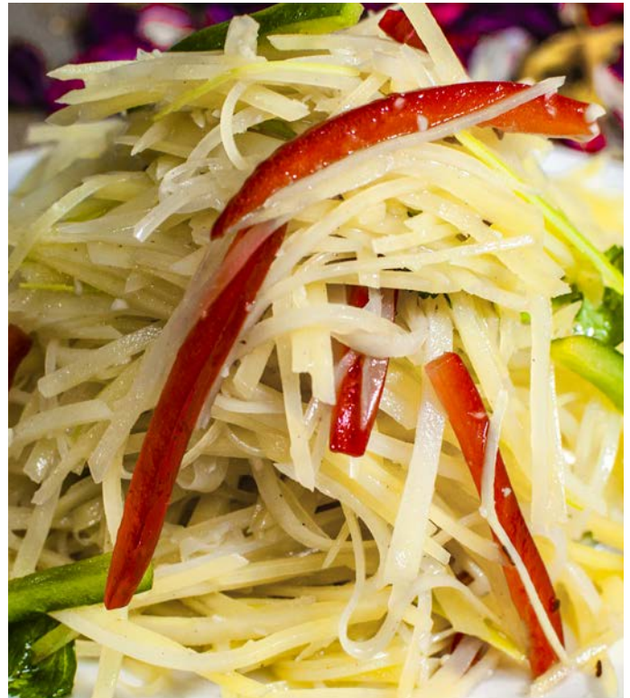
1.3. САЛАТ ИЗ КАРТОФЕЛЬНОЙ СОЛОМКИ С ЧЕСНОКОМ 凉拌土豆丝