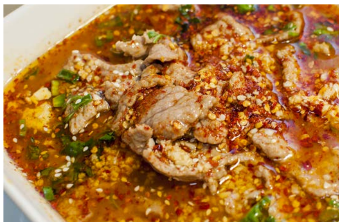
11.8. ТУШЕНАЯ ГОВЯДИНА С ТОФУ В БУЛЬОНЕ 500 г 437₽ 豆花牛柳