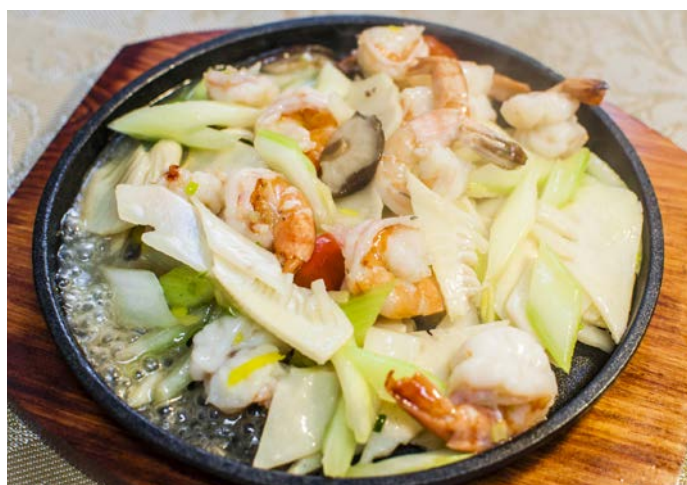
8.9. КОРОЛЕВСКИЕ КРЕВЕТКИ 铁板大虾