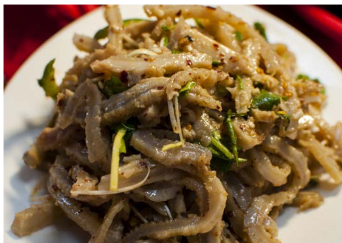
1.15. СОЛОМКА ИЗ ГОВЯЖЬЕГО ЖЕЛУДКА В ОСТРОМ СОУСЕ 蒜香牛肚