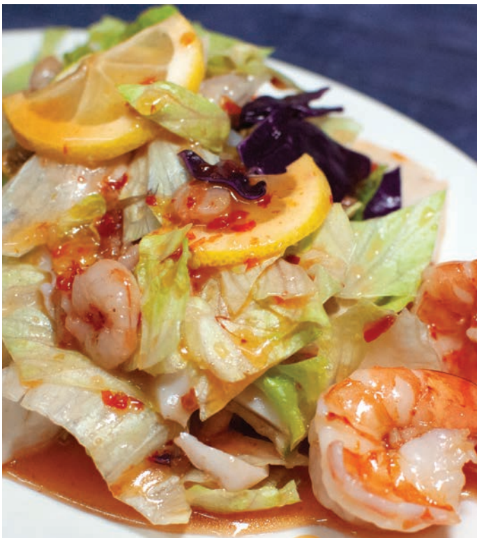
1.4. САЛАТ ИЗ КАПУСТЫ С МОРЕПРОДУКТАМИ В СОУСЕ СВИТ ЧИЛИ 泰国鸡酱海鲜沙拉