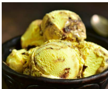
МОРОЖЕНОЕ БАНАНОВОЕ С ШОКОЛАДНЫМ СОУСОМ 香蕉巧克力味