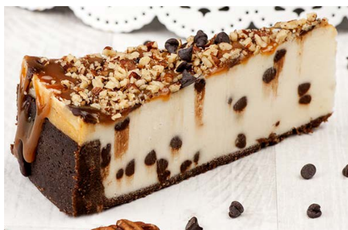
ЧИЗКЕЙК С ШОКОЛАДНОЙ КРОШКОЙ И ОРЕХАМИ ПЕКАН 巧克力干果芝士