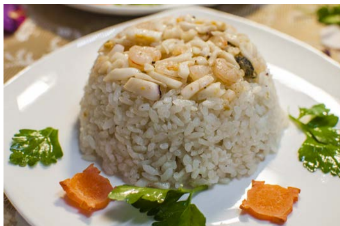
13.6. ЖАРЕНый РИС С МОРЕПРОДУКТАМИ