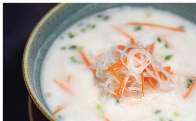
2.10. СЛИВОЧНЫЙ СУП С ДАЙКОНОМ И МОРКОВЬЮ 奶香萝卜汤