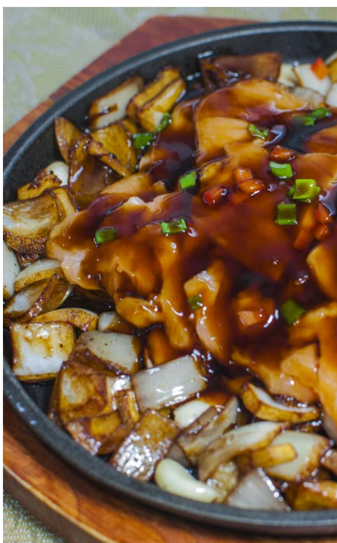
8.15. ФИЛЕ ЛОСОСЯ С ОВОЩАМИ