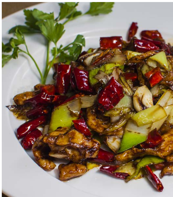
11.13. ЖАРЕНАЯ СВИНИНА С ПЕРЦЕМ ЧИЛИ 干辣椒炒肉