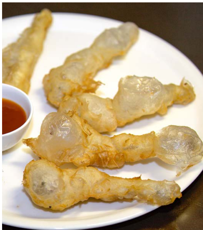
7.14. ЖАРЕННЫЕ ЛЯГУШАЧЬИ ЛАПКИ В КЛЯРЕ