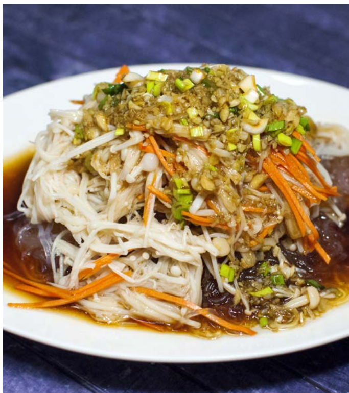
3.8. ЖАРЕННЫЕ ГРИБЫ "ЗОЛОТЫЕ НИТИ" С ПРОЗРАЧНОЙ ЛАПШОЙ И ЧЕСНОКОМ 蒜蓉粉丝金针菇