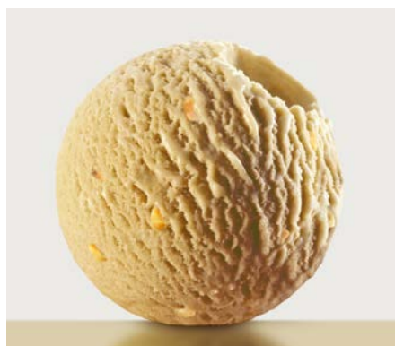
ИМБИРНЫЙ ПРЯНИК 生姜饼干味