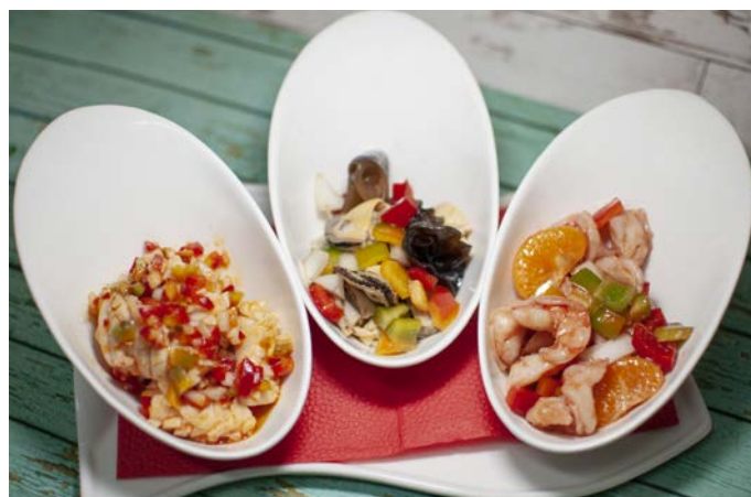
1.28. АССОРТИ ИЗ МОРЕПРОДУКТОВ (КАЛЬМАРЫ В ОСТРОМ СОУСЕ, МИДИИ, КРЕВЕТКИ)