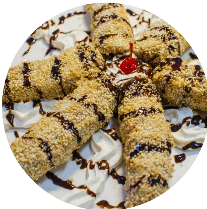
16.6. БАНАНЫ В САХАРНО-КУНЖУТНОЙ ШУБКЕ