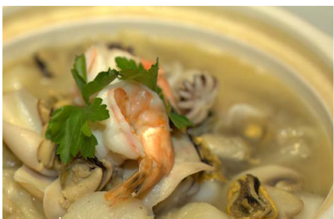
10.6. МОРЕПРОДУКТЫ С ОВОЩАМИ И ГРИБАМИ