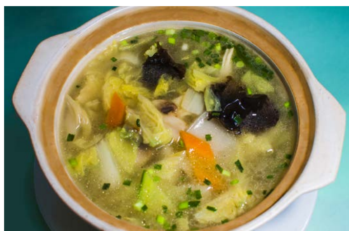
10.5. АССОРТИ ИЗ ОВОЩЕЙ С ГРИБАМИ