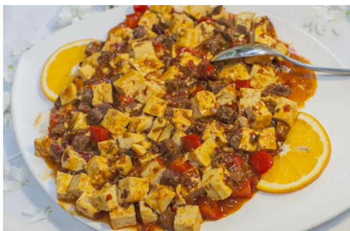
9.2. ТОФУ С ГОВЯДИНОЙ В ОСТРОМ СОУСЕ