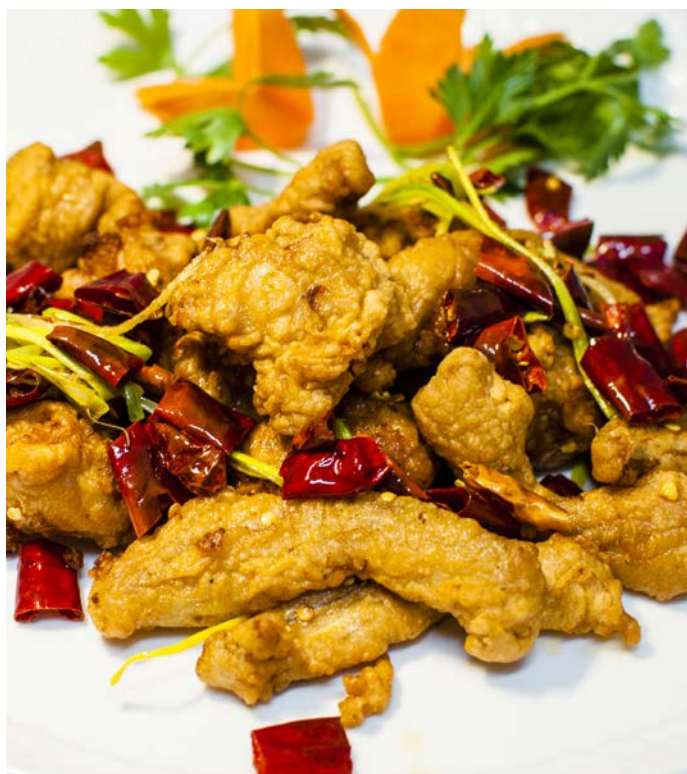
11.12. ХРУСТЯЩИЕ ЛЯГУШАЧЬИ ЛАПКИ С ПЕРЦЕМ ЧИЛИ 麻辣蛙腿