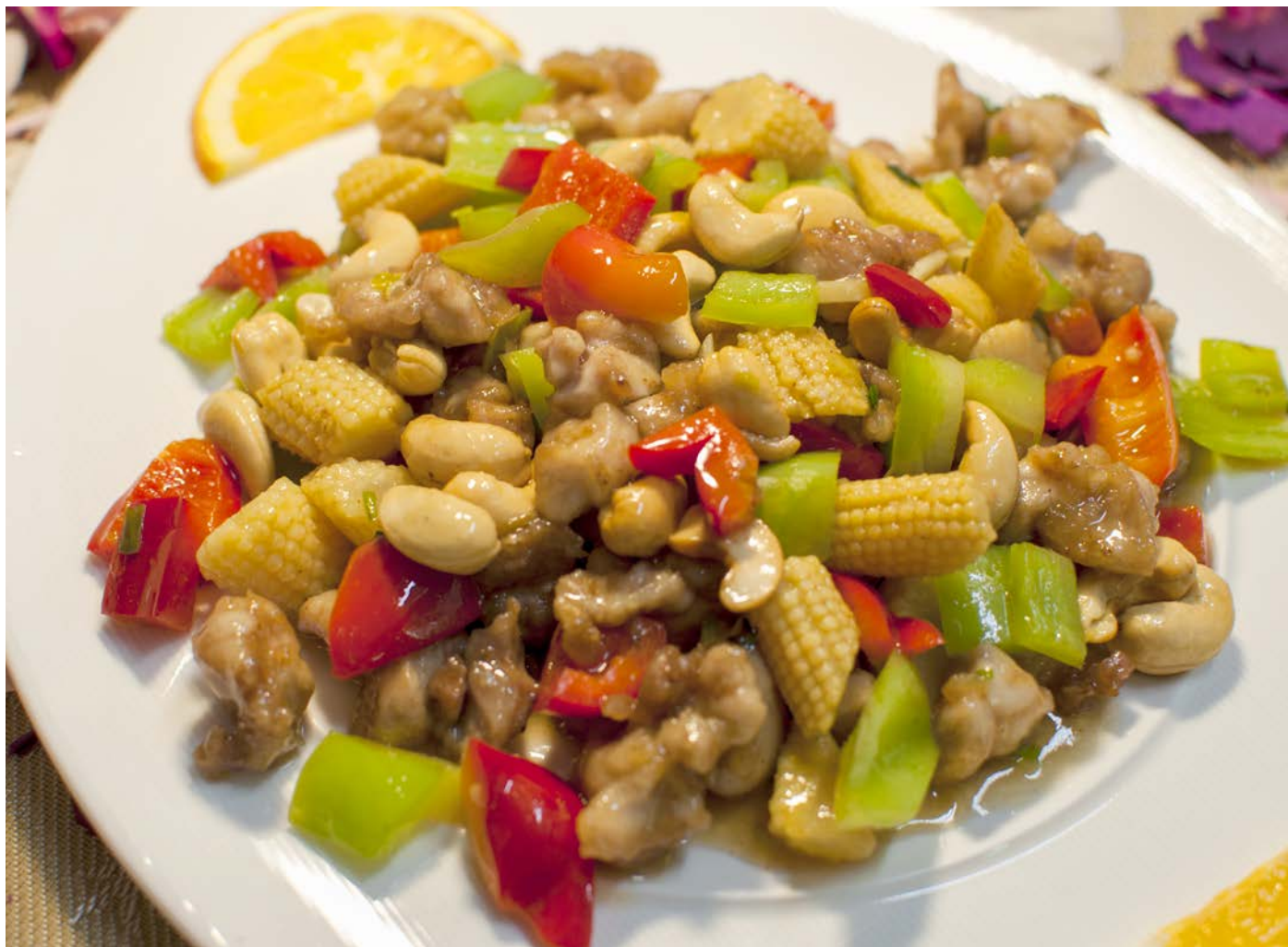
5.5. ЖАРЕНОЕ КУРИНОЕ ФИЛЕ С КЕШЬЮ