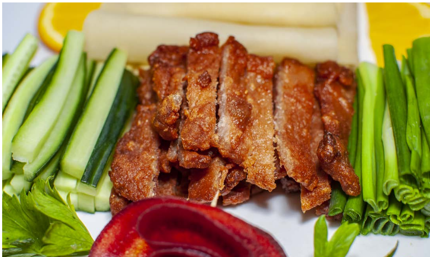
4.8. СВИНИНА ПО-ТАЙВАНЬСКИ ПОДАЕТСЯ С ПАРОВЫМИ БЛИНЧИКАМИ, ОГУРЦОМ И ЧЕСНОЧНОЙ ЧИЛИ ПАСТОЙ 台湾脆卤肉