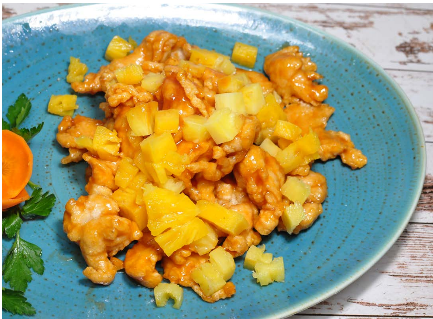
5.8. ЖАРЕНОЕ КУРИНОЕ ФИЛЕ В НЕЖНОМ КЛЯРЕ С КИСЛО-СЛАДКИМ СОУСОМ 糖醋鸡柳