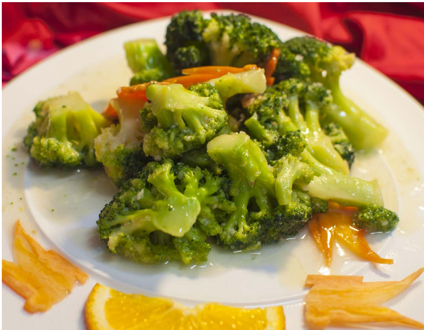
3.10. БРОККОЛИ В ЧЕСНОЧНОМ СОУСЕ 蒜蓉西兰花