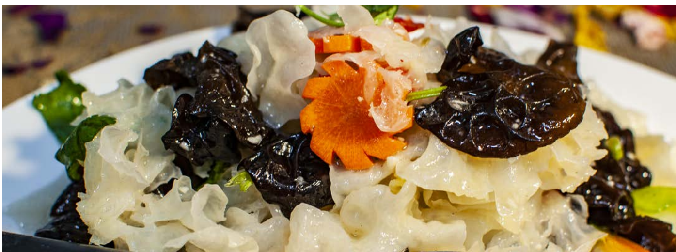
1.8. САЛАТ ИЗ БЕЛЫХ ДРЕВЕСНЫХ ГРИБОВ В ЧЕСНОЧНОМ СОУСЕ