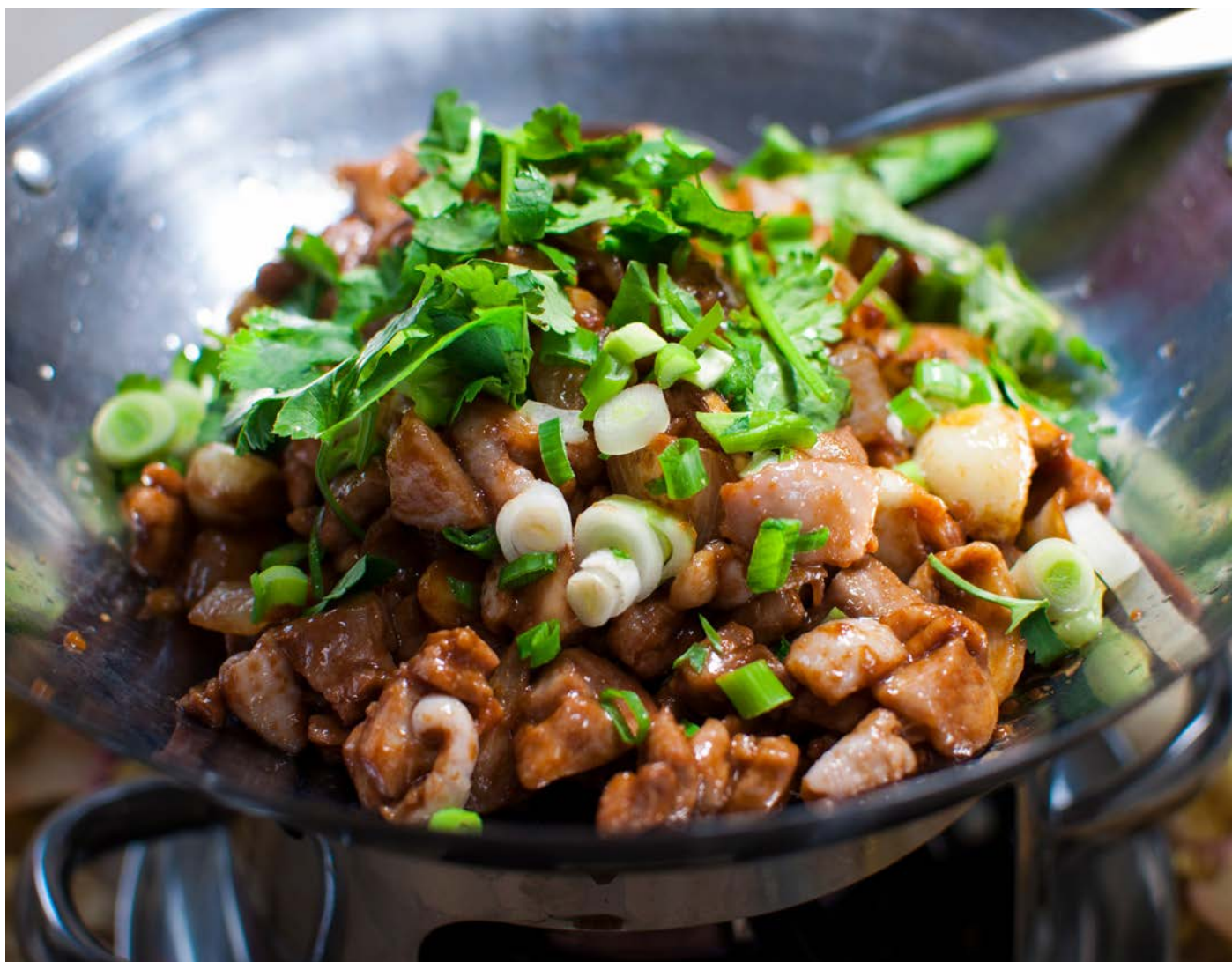
5.2. КУСОЧКИ КУРИЦЫ В СОУСЕ ОТ ШЕФ-ПОВАРА 啲啲鸡块