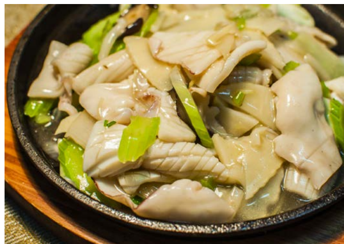
8.7. КАЛЬМАРЫ 铁板鱿鱼