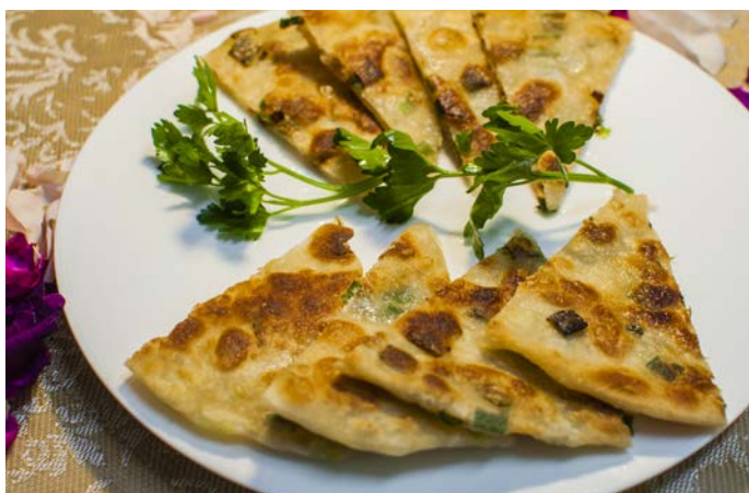
15.10. ЛЕПЕШКИ С ЛУКОМ ПОРЕЙ 葱花饼