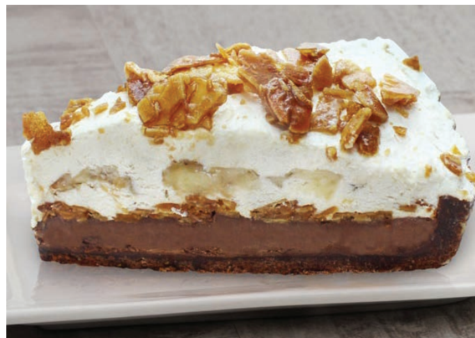
ТОРТ БАНАНОВО-ШОКОЛАДНЫЙ 香蕉巧克力蛋糕