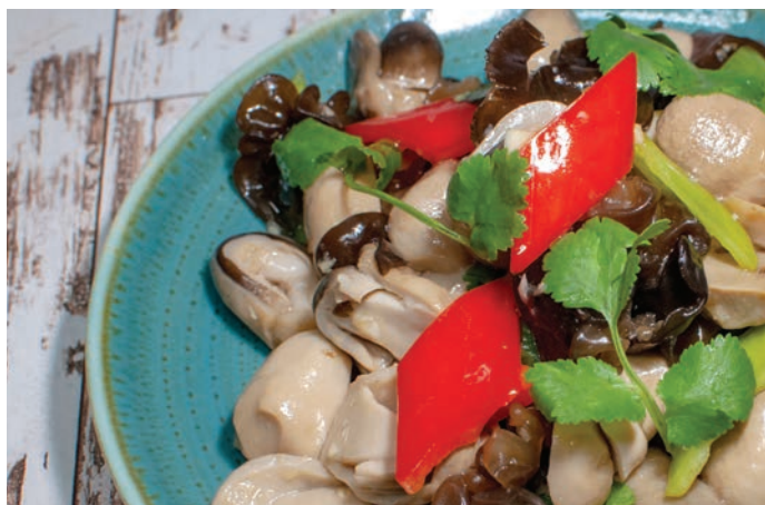
1.21. САЛАТ ИЗ КИТАЙСКИХ ТРАВЯНЫХ ГРИБОВ