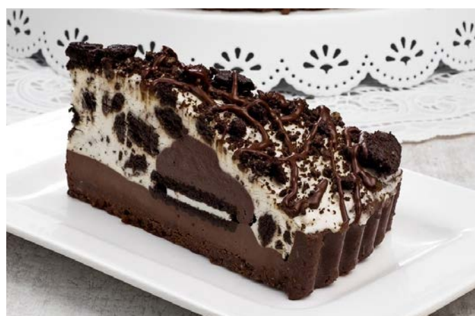
ЧИЗКЕЙК С КУСОЧКАМИ ПЕЧЕНЬЯ "ДРИМ ЭКСТРИМ" 饼干芝士