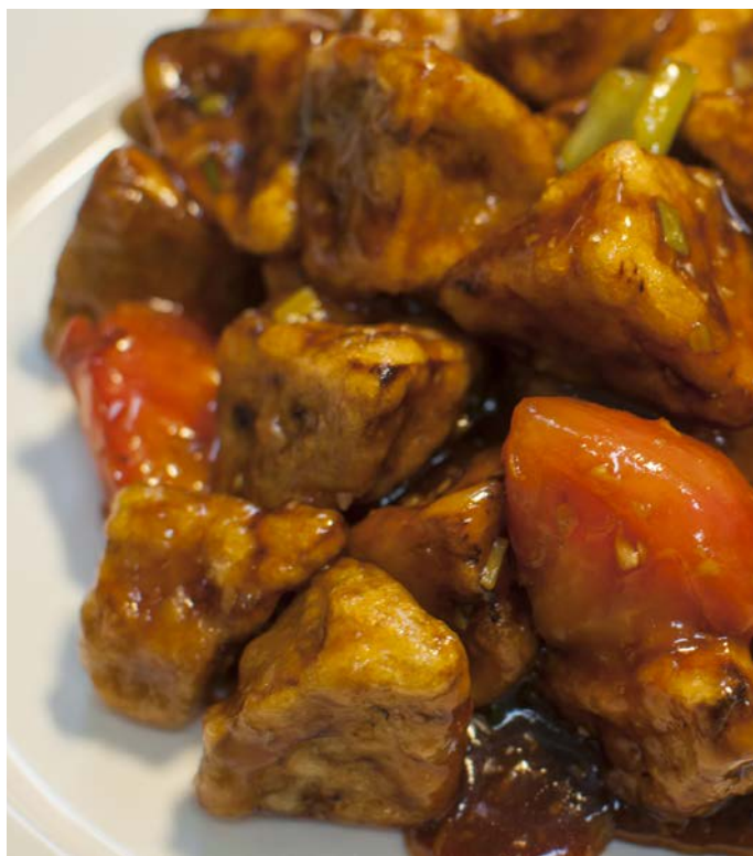
3.6. ЖАРЕННЫЕ БАКЛАЖАНЫ В СОЕВОМ СОУСЕ 焦溜茄子