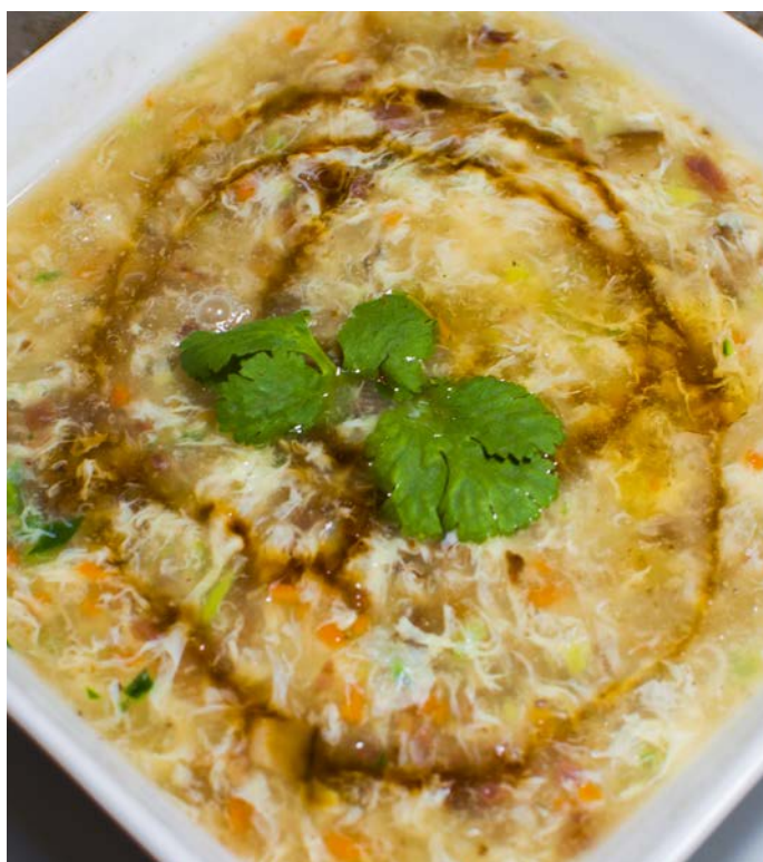
2.4. СУП ИЗ ГОВЯДИНЫ ПО «СИХУСКИ»