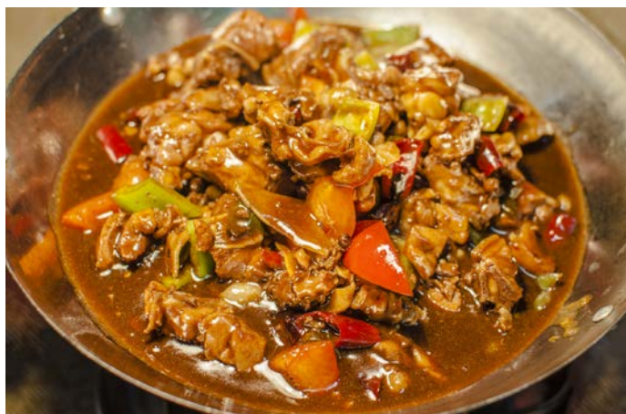
12.2. КУРИЦА (НА КОСТОЧКАХ) 干锅仔鸡