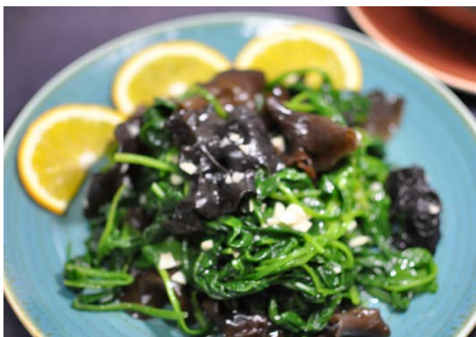
3.3. ЖАРЕННЫЙ ШПИНАТ С ГРИБАМИ МУЭР В ЧЕСНОЧНОМ СОУСЕ