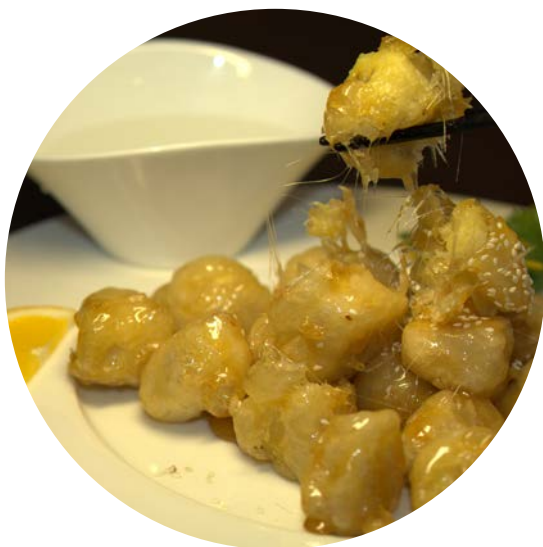
16.5. ФРУКТОВОЕ АССОРТИ В КАРАМЕЛИ