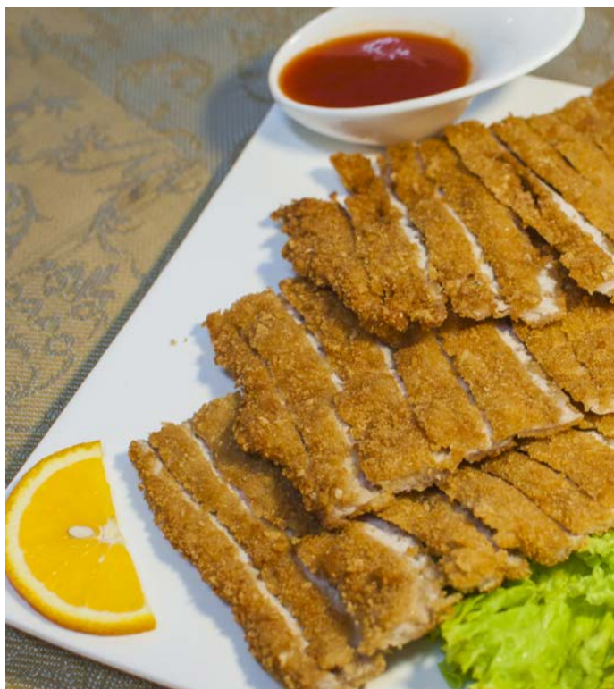
4.10. ЖАРЕНАЯ СВИНИНА В АРОМАТНОЙ ПАНИРОВКЕ 中式肉排