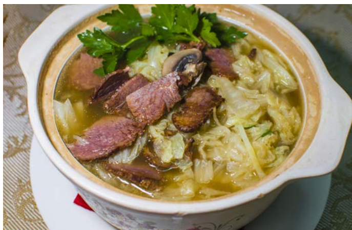
10.2. ГОВЯДИНА С ОВОЩАМИ И ГРИБАМИ