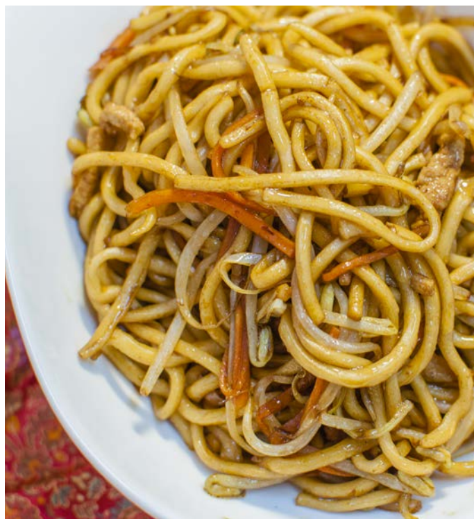
14.3. ЖАРЕНАЯ ЛАПША СО СВИНИНОЙ 肉丝炒面