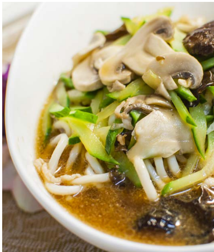
14.5. ЛАПША СО СВИНИНОЙ В БУЛЬОНЕ 肉丝汤面