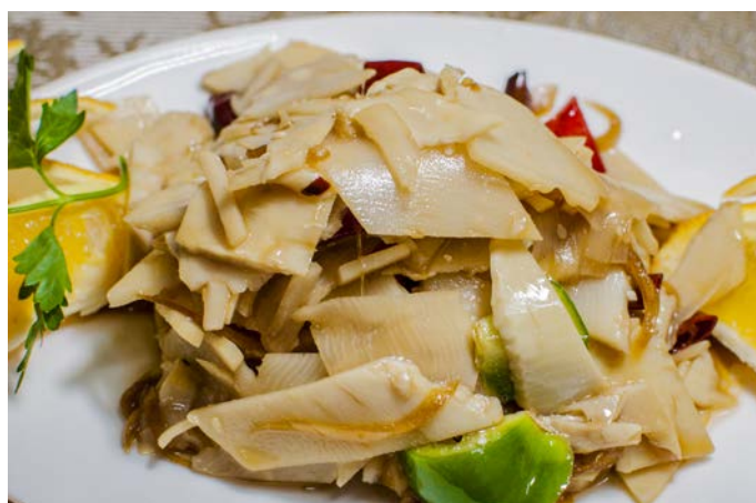
1.25. САЛАТ ИЗ БАМБУКА