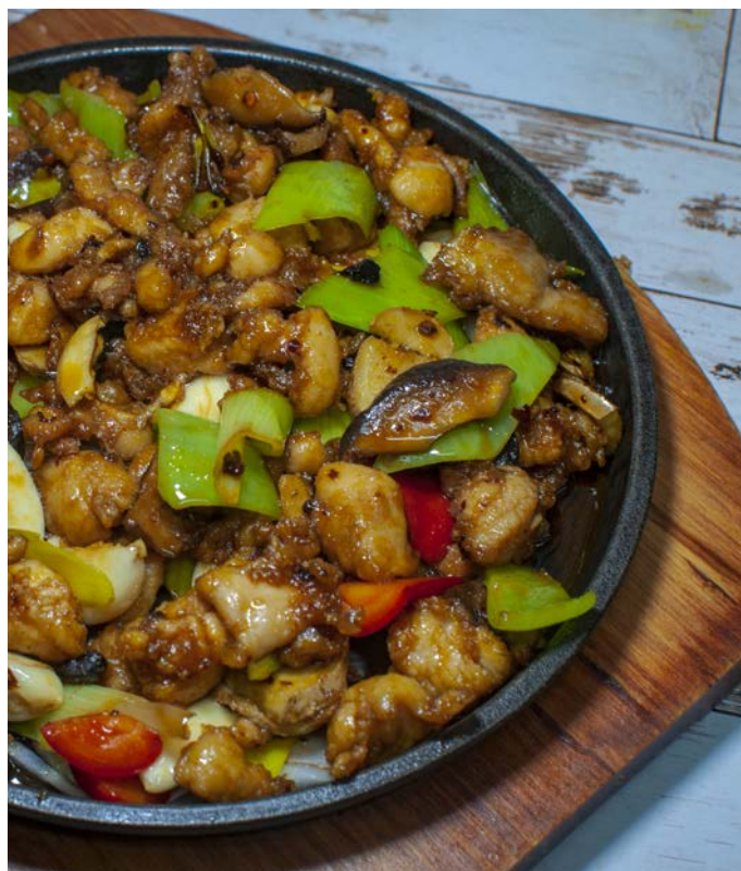
8.3. ПРЯНЫЕ КУСОЧКИ КУРИЦЫ С ОВОЩАМИ 铁板香辣鸡丁