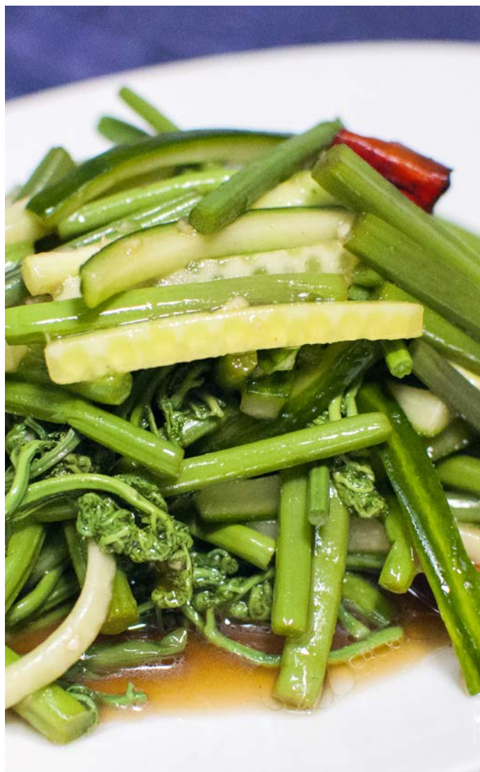
1.32. ХРУСТЯЩИЙ ПАПОРОТНИК С ОСТРЫМ ПЕРЦЕМ 200 г 377₽ 爽口蕨菜