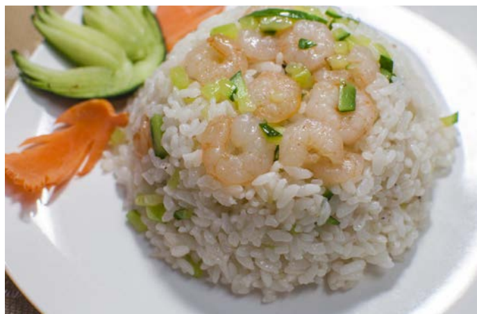
13.5. ЖАРЕНый РИС С КРЕВЕТКАМИ