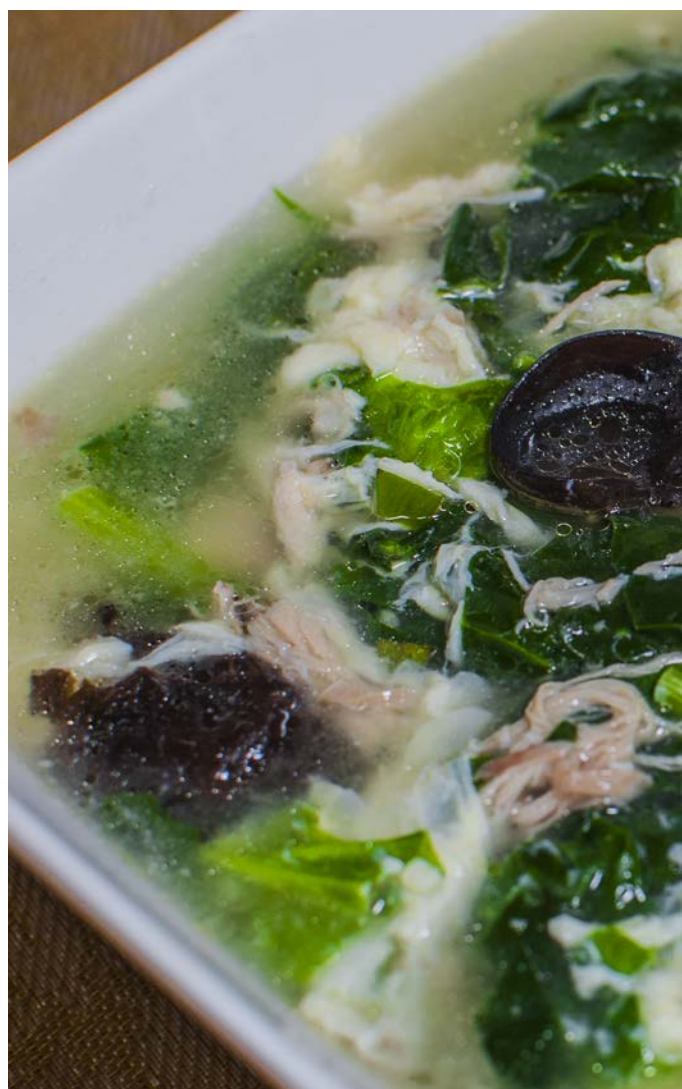
2.8. СУП СО ШПИНАТОМ, КУРИЦЕЙ И ЯЙЦОМ 菠菜鸡丝蛋花汤