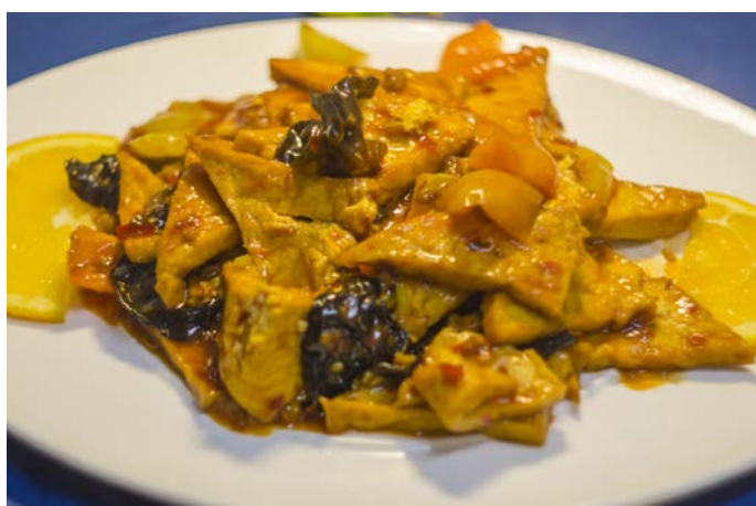
9.5. ТОФУ ПО-ДОМАШНЕМУ СО СВИНИНОЙ И ГРИБАМИ