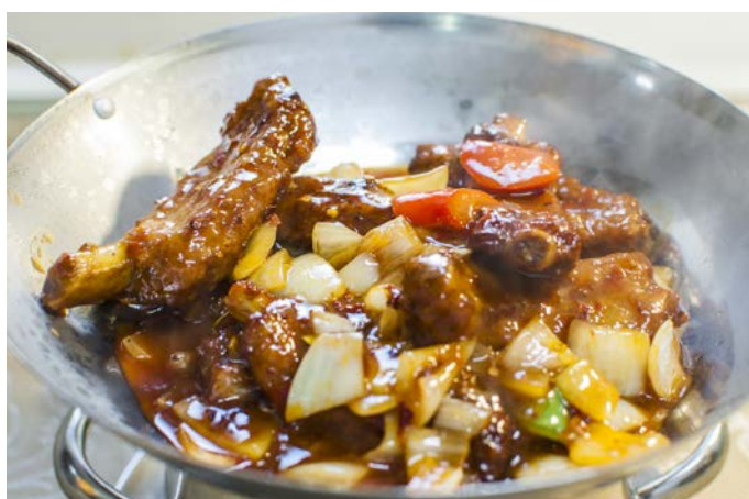
12.3. СВИНЫЕ РЕБРЫШКИ 干锅排骨