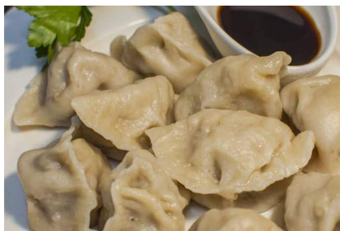
15.5. КИТАЙСКИЕ ПЕЛЬМЕНИ С БАРАНИНОЙ 羊肉水饺