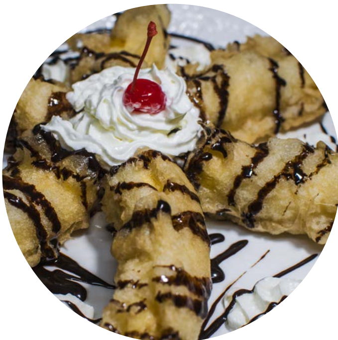
16.7. БАНАНОВЫЕ РУЛЕТКИ С ФРУКТОВЫМ ДЖЕМОМ В КЛЯРЕ