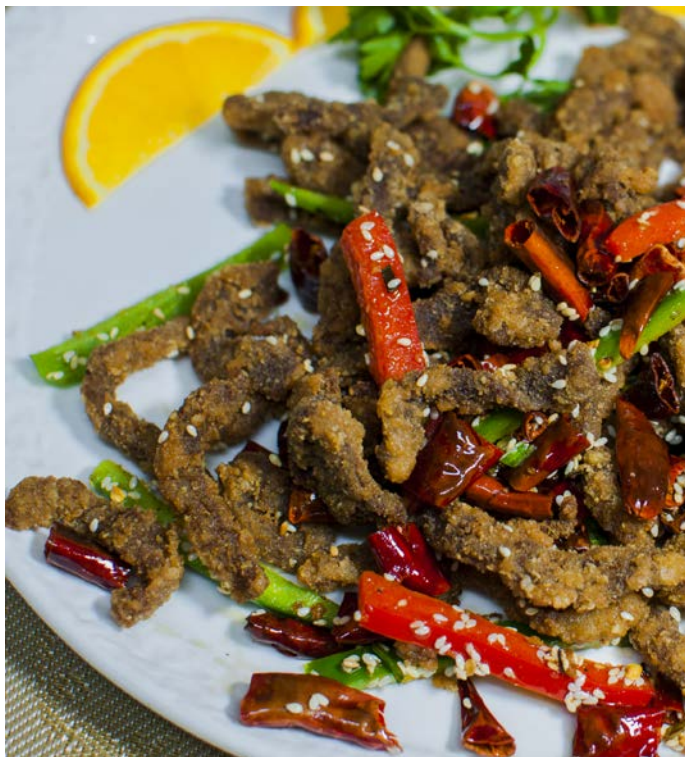
6.5. ХРУСТЯЩАЯ СОЛОМКА ИЗ ФИЛЕ ГОВЯДИНЫ В ОСТРЫХ ПРИПРАВАХ 香阁干煸牛肉丝