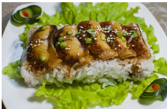
13.8. РИС С КОПЧЕНЫМ УГРЕМ