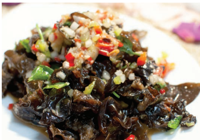
1.14. САЛАТ ИЗ ГРИБОВ МУЭР С БОЛГАРСКИМ ПЕРЦЕМ 凉拌木耳