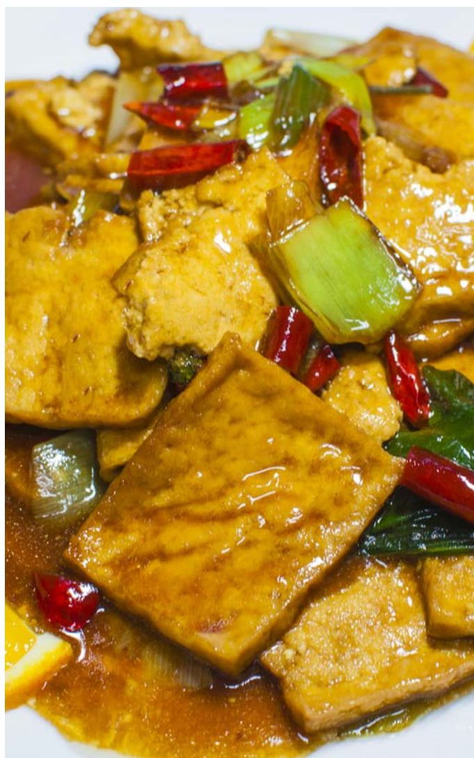
9.4. ТОФУ ЖАРЕНЫЙ С ЛУКОМ ПОРЕЙ