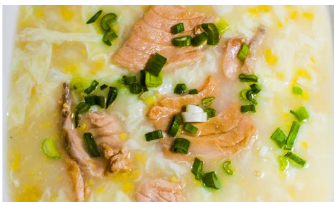
2.9. СЛАДКИЙ СЛИВОЧНЫЙ СУП С ЛОСОСЕМ, КУКУРУЗОЙ И ЯЙЦОМ 三文鱼玉米汤