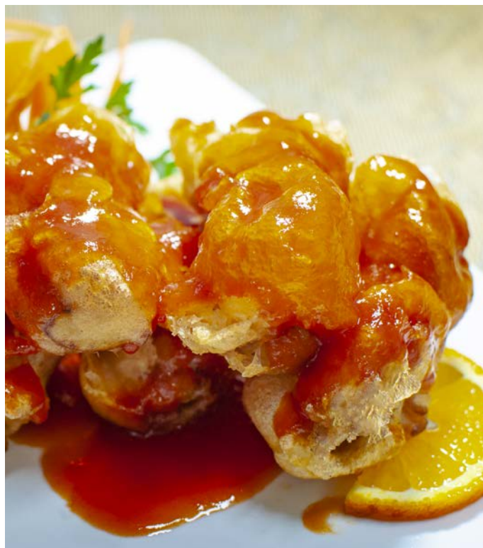
7.12. РЫБНЫЕ РУЛЕТИКИ С БАНАНОМ В КИСЛО-СЛАДКОМ СОУСЕ