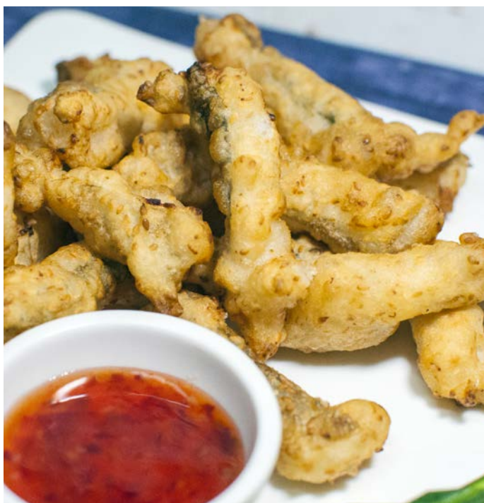
7.2. ФИЛЕ СУДАКА В КУНЖУТЕ 200 г 427₽ (ПОДАЕТСЯ С СОУСОМ СВИТ ЧИЛИ И КИСЛО-СЛАДКИМ СОУСОМ) 芝麻鱼条