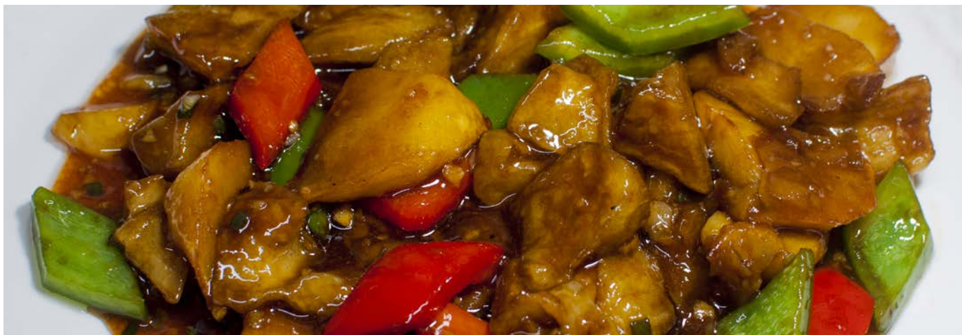
3.2. ЖАРЕННЫЕ БАКЛАЖАНЫ С КАРТОФЕЛЕМ И СЛАДКИМ ПЕРЦЕМ