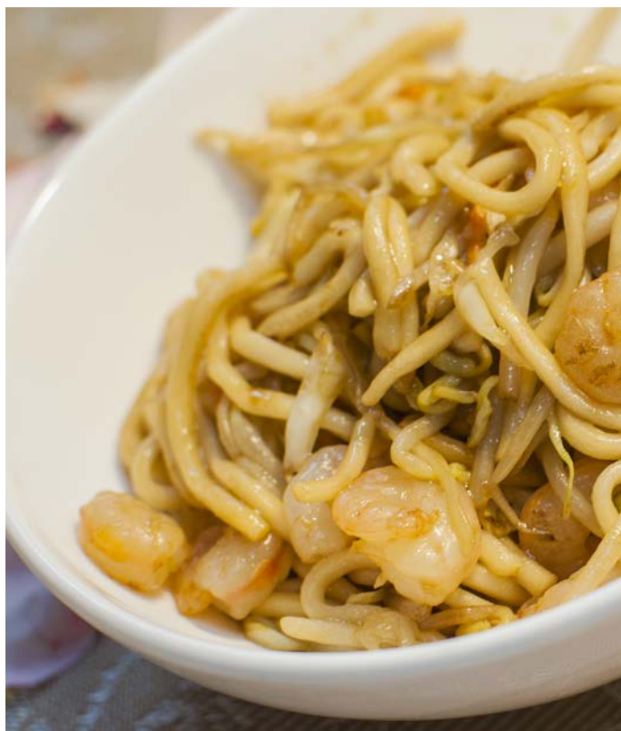
14.4. ЖАРЕНАЯ ЛАПША С КРЕВЕТКАМИ 虾仁炒面