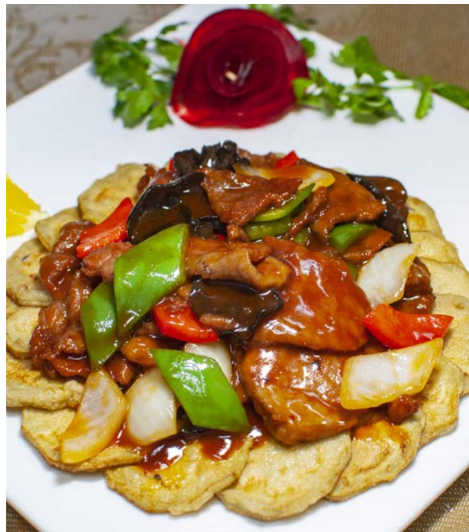
6.6. ЖАРЕНОЕ ФИЛЕ ГОВЯДИНЫ С БАКЛАЖАНАМИ 番茄牛肉