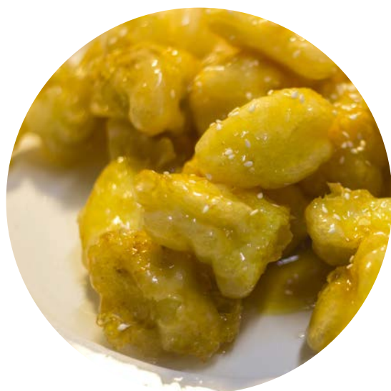
16.3. АНАНАСЫ В КАРАМЕЛИ