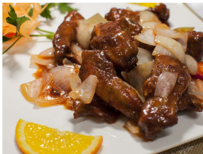
4.4. СВИНЫЕ РЕБРЫШКИ В СОЕВОМ СОУСЕ 港式排骨