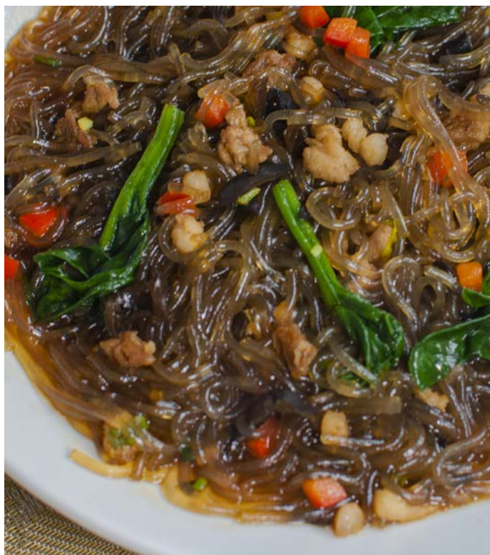
14.10. ЖАРЕНАЯ ПРОЗРАЧНАЯ ЛАПША СО СВИНИНОЙ