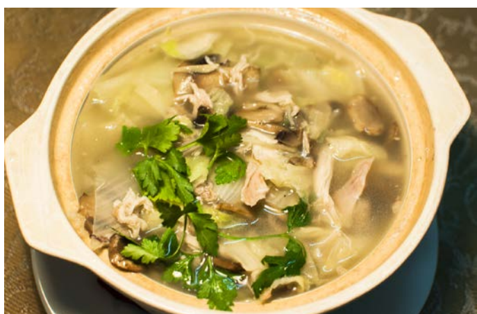
10.4. КУРИЦА С ОВОЩАМИ И ГРИБАМИ