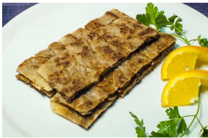
15.11. ЛЕПЕШКИ С ГОВЯДИНОЙ 贴锅牛肉