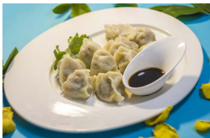
15.4. КИТАЙСКИЕ ПЕЛЬМЕНИ С ГОВЯДИНОЙ 牛肉水饺