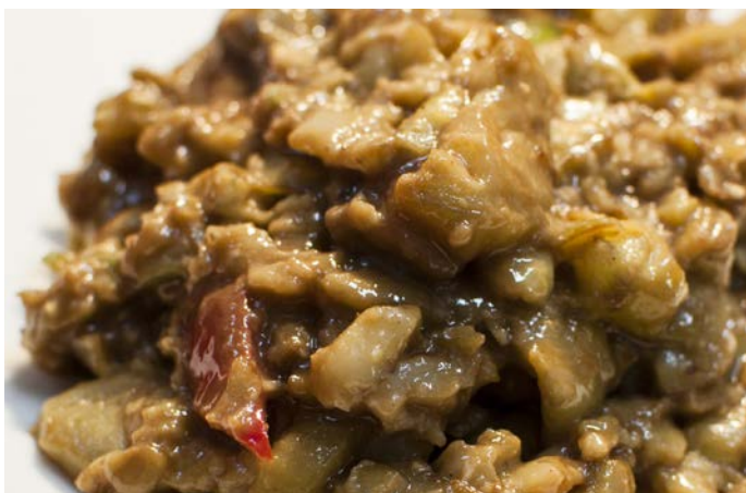
1.20. САЛАТ ИЗ БАКЛАЖАН В КУНЖУТНОМ СОУСЕ 麻酱茄子