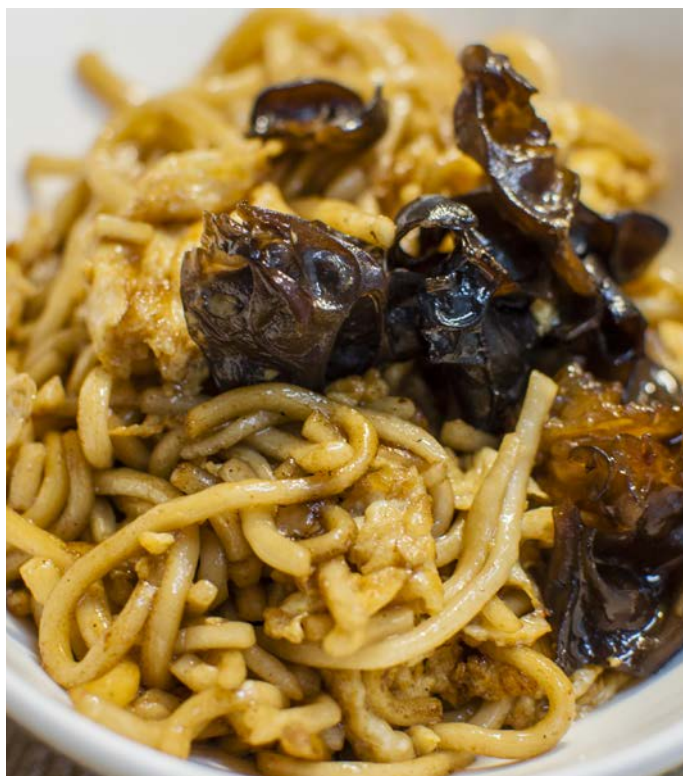
14.2. ЖАРЕНАЯ ЛАПША С ЯЙЦОМ 鸡蛋炒面