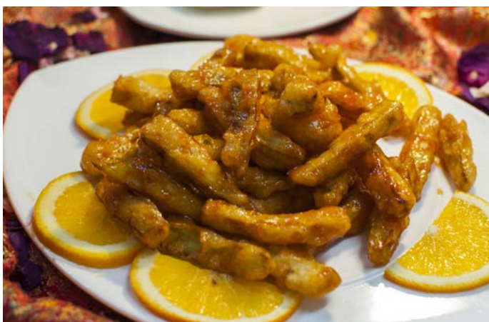
3.5. ЖАРЕННЫЕ БАКЛАЖАНЫ В КИСЛО-СЛАДКОМ СОУСЕ