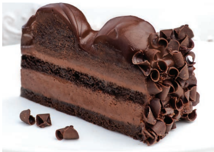
ТОРТ "МУСС 3 ШОКОЛАДА" 焦糖巧克力蛋糕