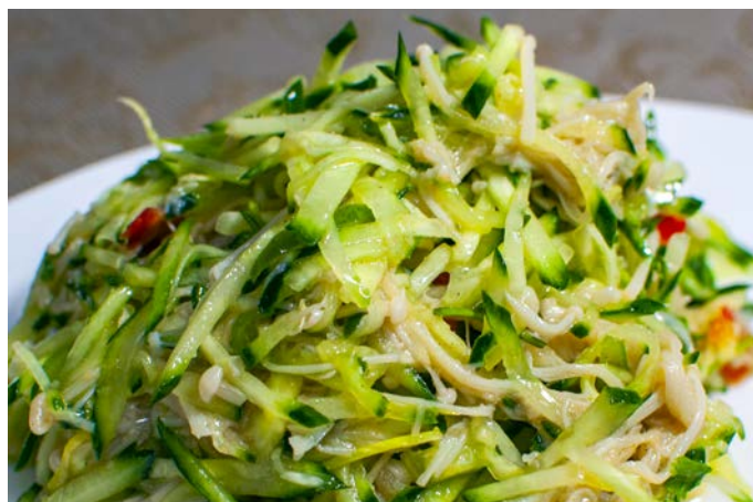
1.22. САЛАТ ИЗ ГРИБОВ «ЗОЛОТЫЕ НИТИ»