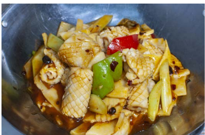
12.6. КАЛЬМАРЫ 铁板鱿鱼