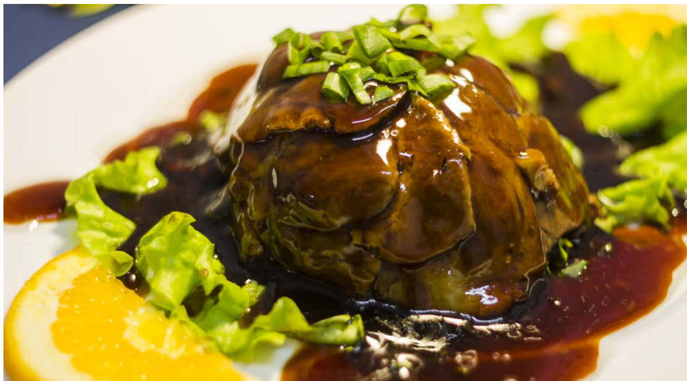
4.9. ТУШЕНАЯ СВИНИНА В СОЕВОМ СОУСЕ 精肉扣肉