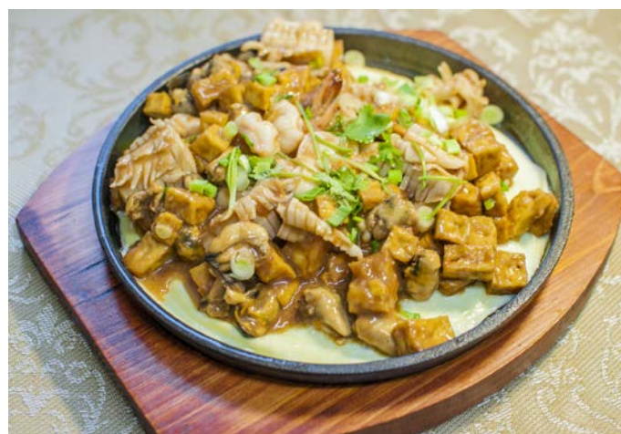
8.10. МОРЕПРОДУКТЫ С ТОФУ И ЯЙЦОМ 铁板海鲜豆腐