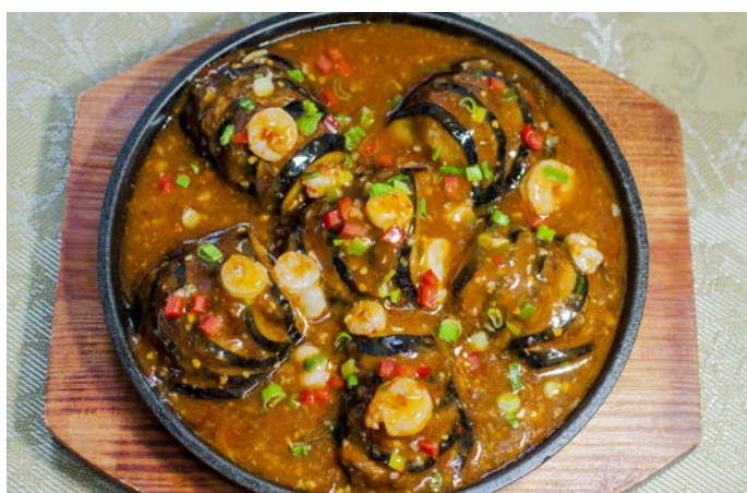
8.13. РУЛЕТКИ ИЗ БАКЛАЖАНОВ СО СВИНИНОЙ И КРЕВЕТКАМИ