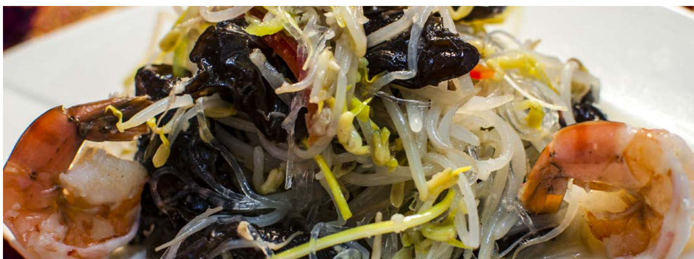
1.23. САЛАТ ИЗ ПРОЗРАЧНОЙ ЛАПШИ С КРЕВЕТКАМИ И РОСТКАМИ СОИ