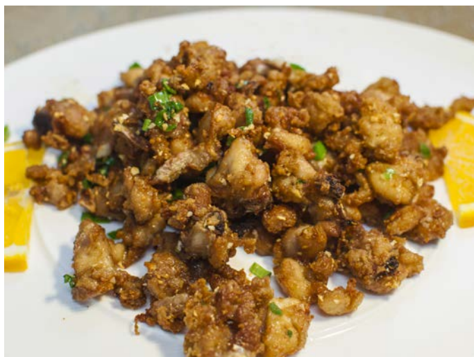
5.3. ЖАРЕНАЯ КУРИЦА С ЧЕСНОКОМ (НА КОСТОЧКАХ) 蒜香煎仔鸡