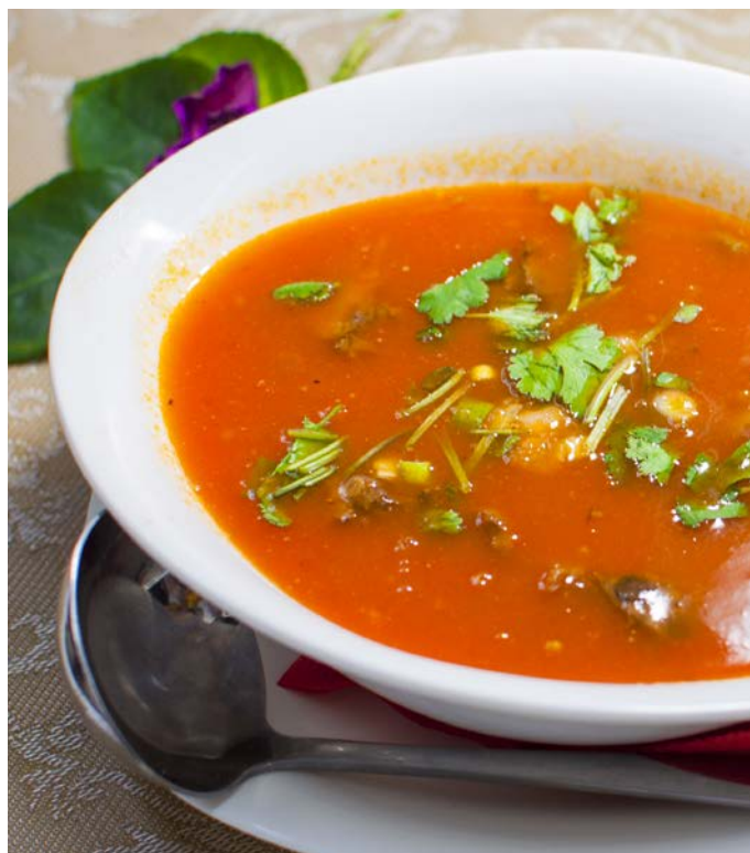
2.5. ТОМАТНЫЙ СУП С ПРЯНОЙ ГОВЯДИНОЙ