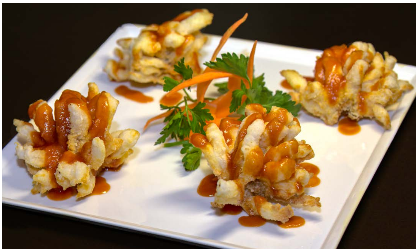
7.17. ФИЛЕ СУДАКА В ФОРМЕ «ХРИЗАНТЕМЫ» В КИСЛО-СЛАДКОМ СОУСЕ 菊花鱼