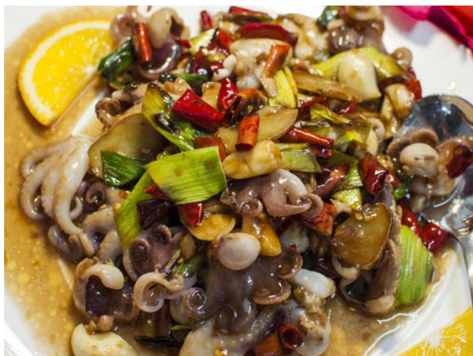
11.3. ЖАРЕННЫЕ ОСЬМИНОЖКИ С ПЕРЦЕМ ЧИЛИ 麻辣小八带