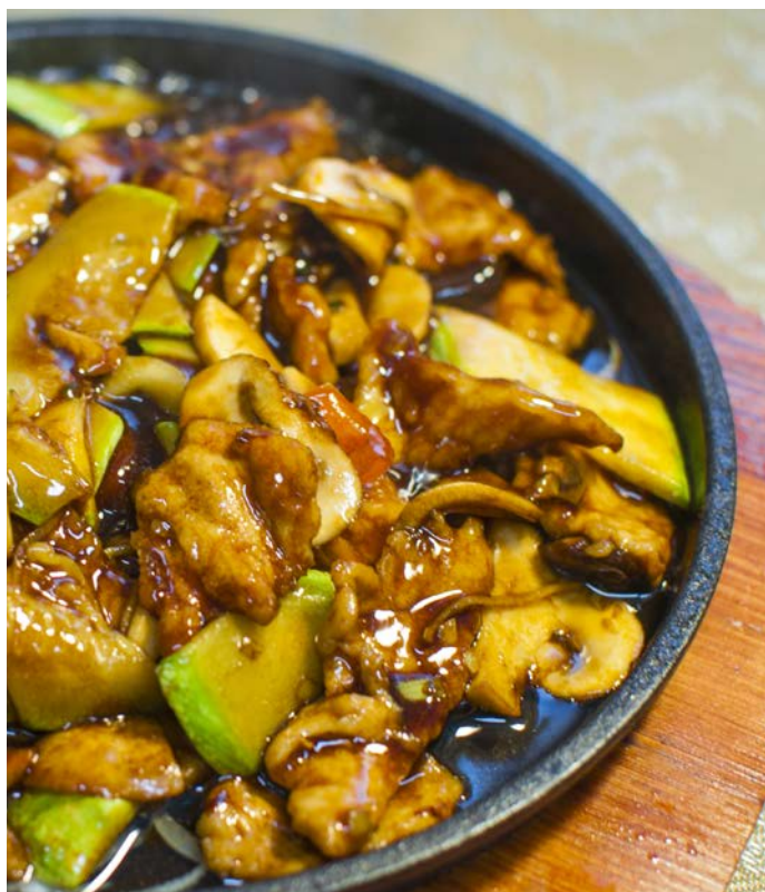
8.2. ФИЛЕ СВИНИНЫ 铁板肉片