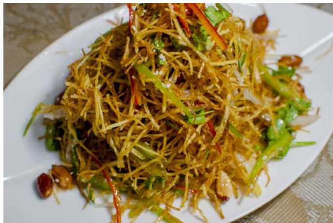
1.30. САЛАТ ИЗ ХРУСТЯЩЕЙ КАРТОФЕЛЬНОЙ СОЛОМКИ С АРАХИСОМ 200 г 367₽ 三丝爆豆