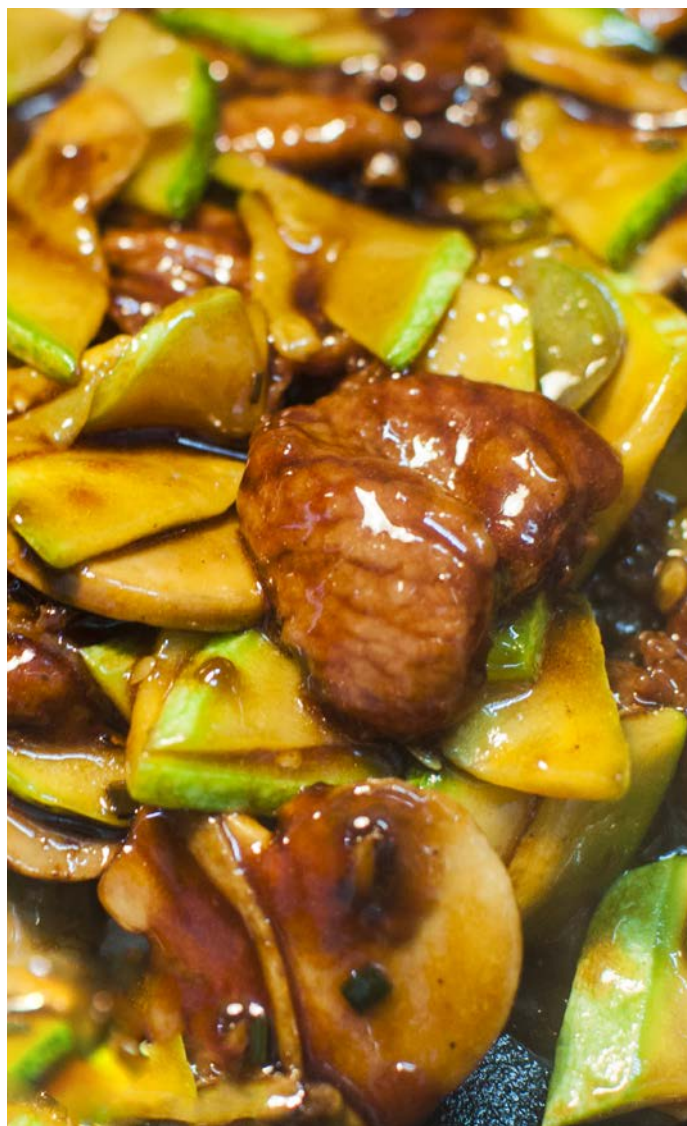
8.6. ФИЛЕ БАРАНИНЫ 铁板羊肉