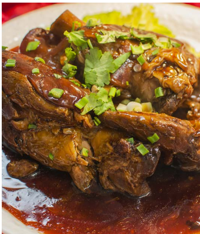
4.12. СВИНАЯ РУЛКА ПО-ПЕКИНСКИ 京式扒肘子