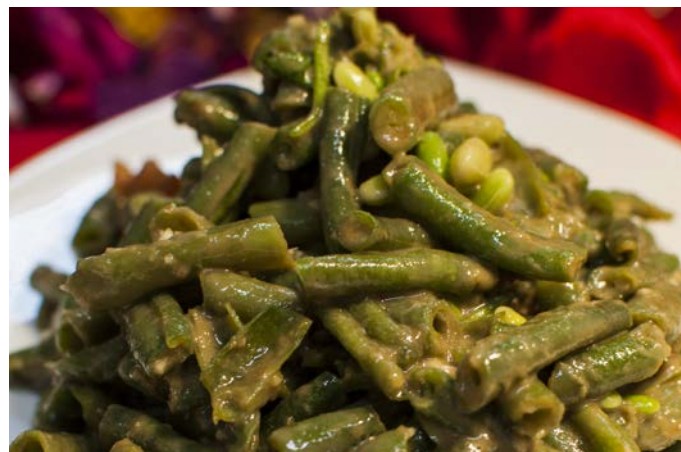
1.7. САЛАТ ИЗ СТРУЧКОВОЙ ФАСОЛИ В КУНЖУТНОМ СОУСЕ