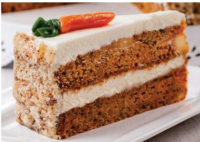
МОРКОВНЫЙ ТОРТ 胡萝卜蛋糕