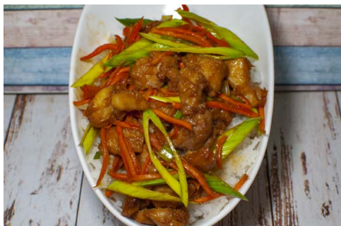
13.9. РИС С КУРИЦЕЙ