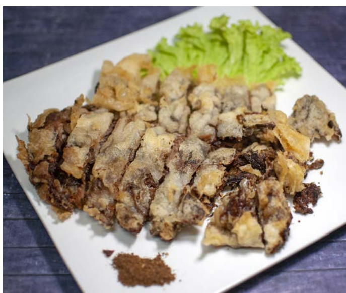
5.9. ХРУСТЯЩАЯ ПРЯНАЯ УТКА 香酥鸭