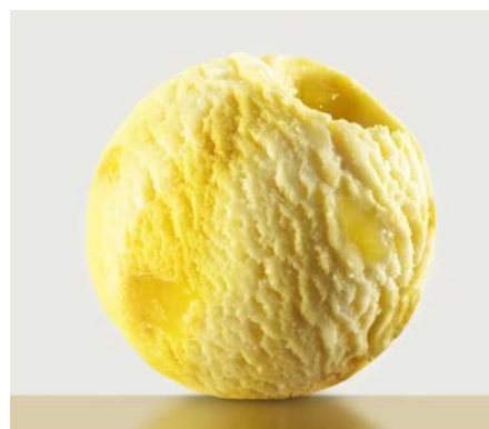
СЛАДКАЯ КУКУРУЗА 甜玉米味