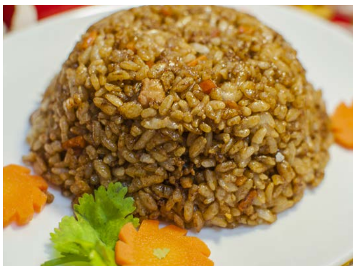
13.3. ЖАРЕНый РИС СО СВИНИНОЙ 猪肉炒饭