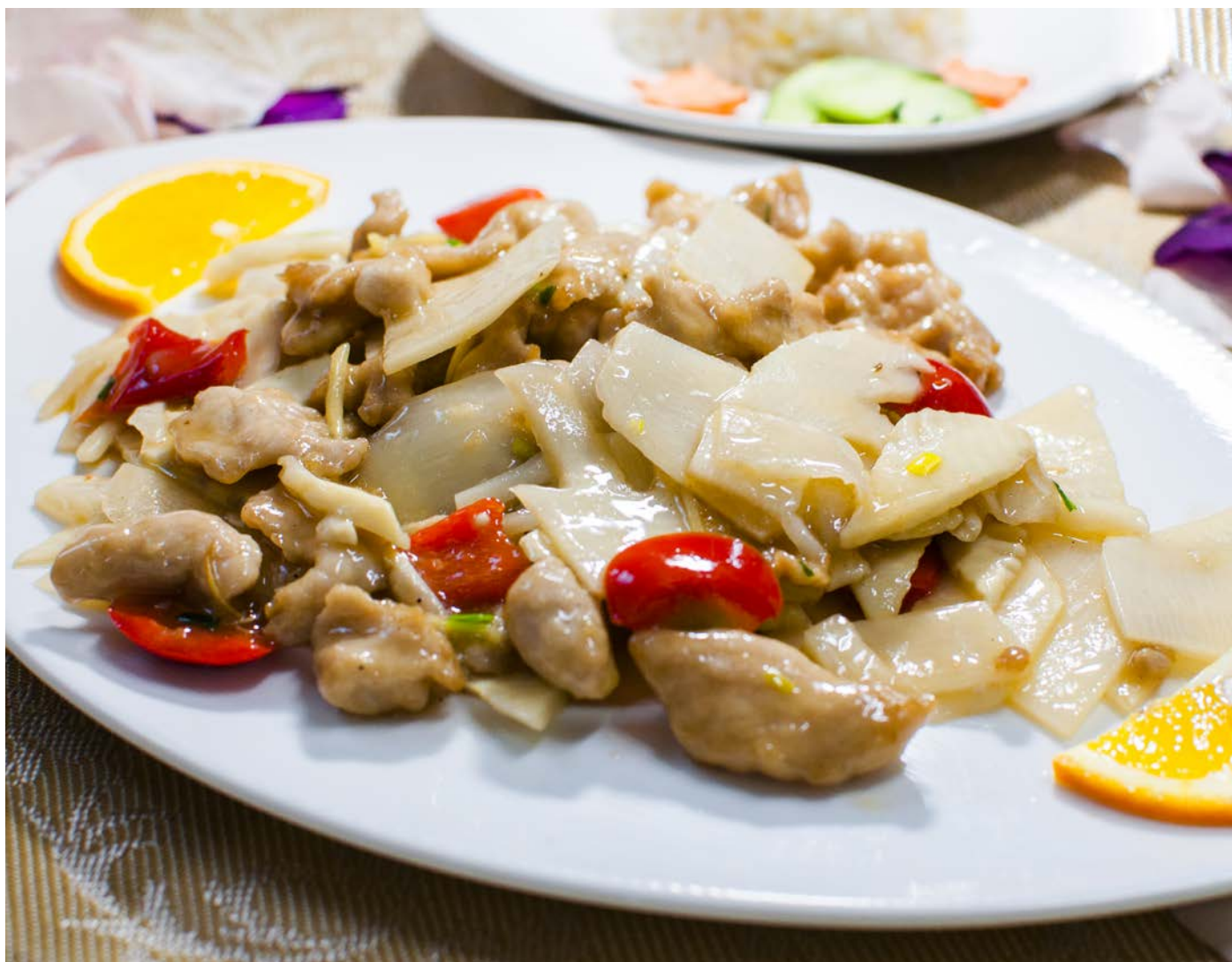
4.2. ЖАРЕНАЯ СВИНИНА С БАМБУКОМ 竹笋肉片