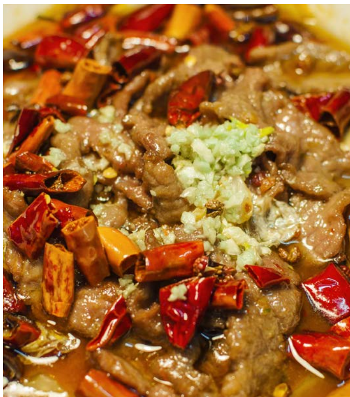
11.10. ОСТРАЯ ГОВЯДИНА В БУЛЬОНЕ С ЗЕЛЕНЫМ ЛУКОМ 川江水煮牛肉