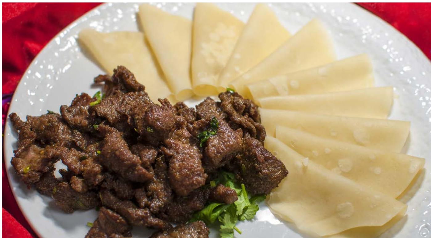
6.4. ПРЯНАЯ БАРАНИНА С БЛИНЧИКАМИ 孜然羊肉卷饼