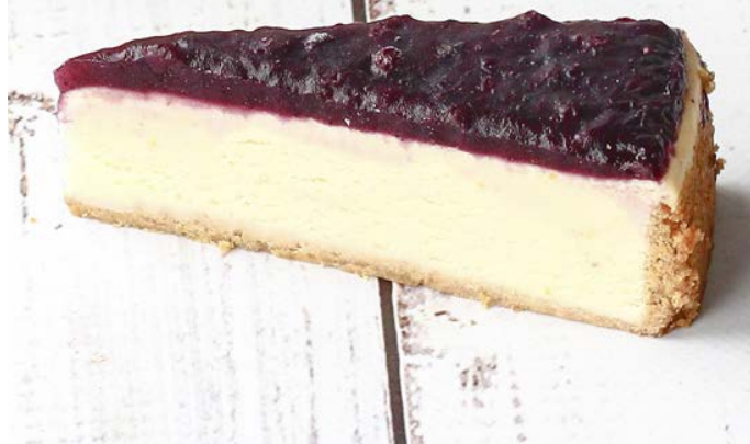
ЧИЗКЕЙК С ЧЕРНИЧНЫМ ТОППИНГОМ 蓝莓芝士。