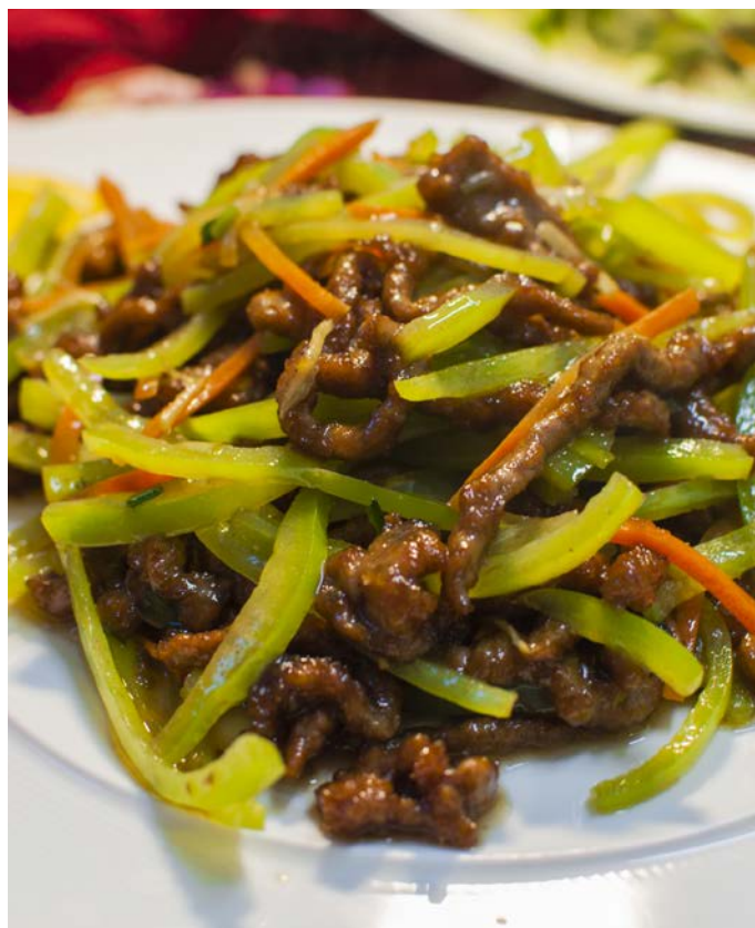
6.3. ЖАРЕНОЕ ФИЛЕ ГОВЯДИНЫ С БОЛГАРСКИМ ПЕРЦЕМ 青椒牛肉丝