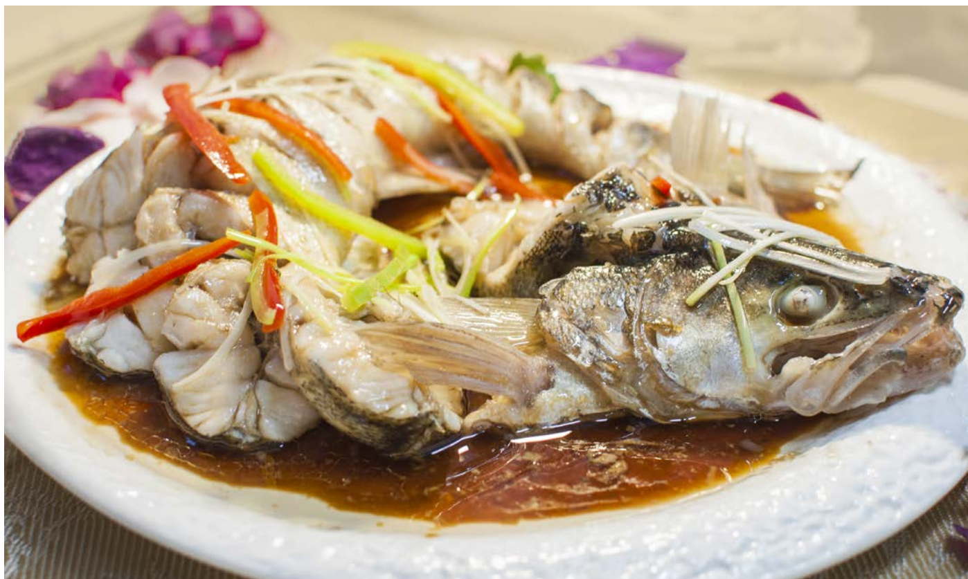
7.20. СУДАК НА ПАРУ С ЗЕЛЕНЬЮ И ПРЯНОСТЯМИ 清蒸苏达克