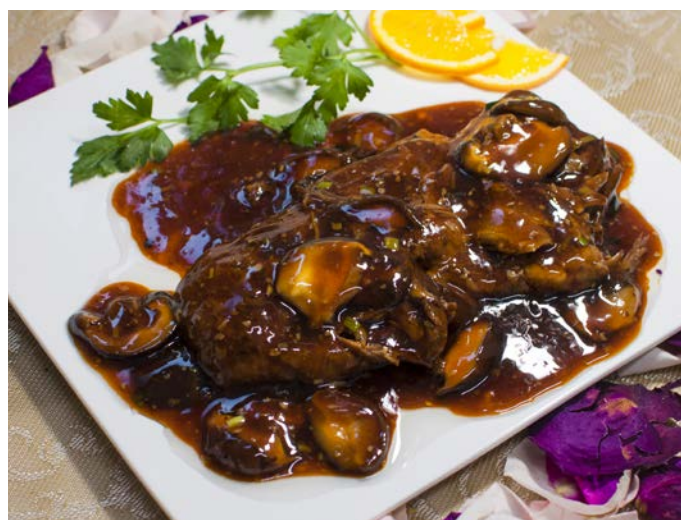
5.7. ЖАРЕНОЕ ФИЛЕ УТКИ ПО-ШАНХАЙСКИ (НА КОСТОЧКАХ)