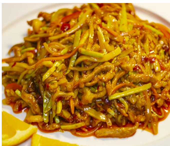
5.10. ЖАРЕНОЕ ФИЛЕ УТКИ В СЛАДКО-ОСТРОМ СОУСЕ 鱼香鸭丝