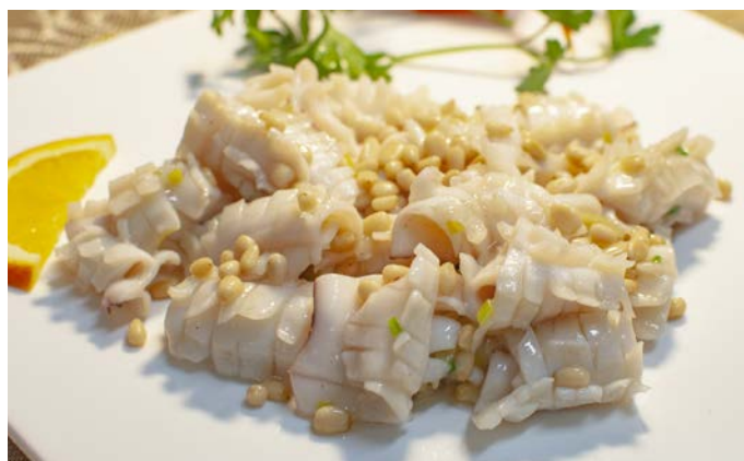
7.10. ЖАРЕННЫЕ КАЛЬМАРЫ С КЕДРОВЫМИ ОРЕШКАМИ