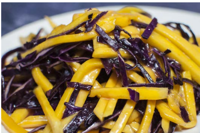
1.31. САЛАТ ИЗ МАНГО И КРАСНОКОЧАННОЙ КАПУСТЫ 200 г 407₽ 芒果沙拉