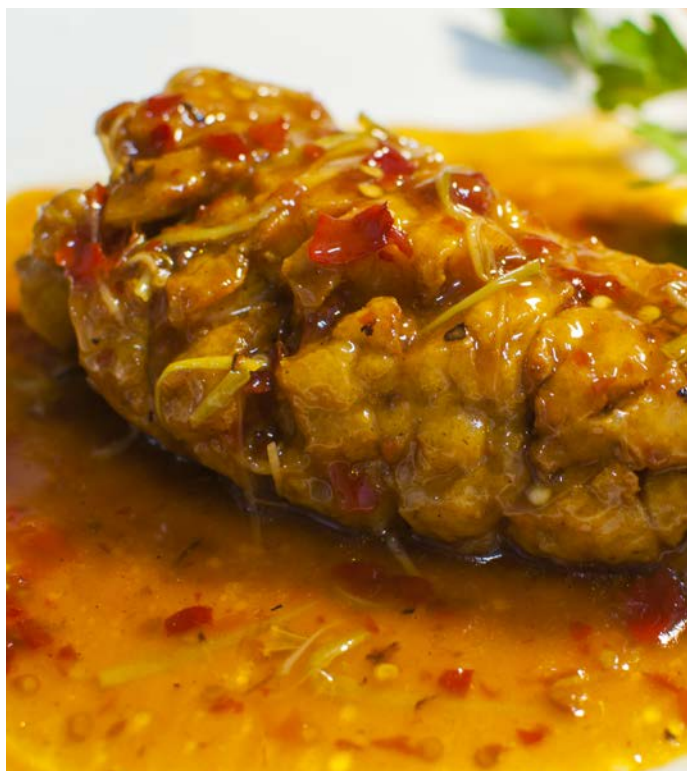
7.15. ФИЛЕ СУДАКА В СЛАДКО-ОСТРОМ СОУСЕ 豆瓣鱼