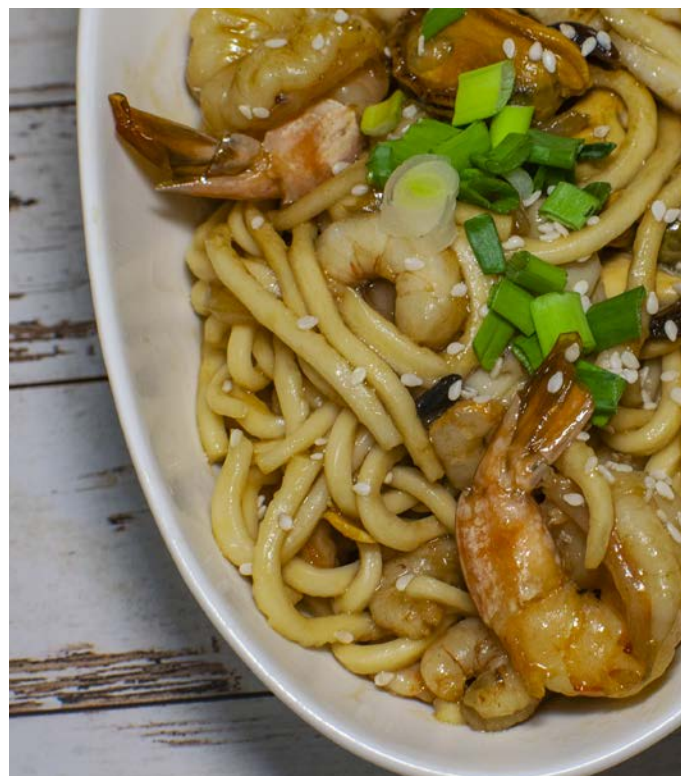
14.7. ЖАРЕНАЯ ЛАПША С МОРЕПРОДУКТАМИ 海鲜炒面