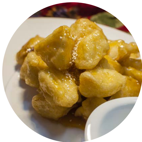
16.1. БАНАНЫ В КАРАМЕЛИ