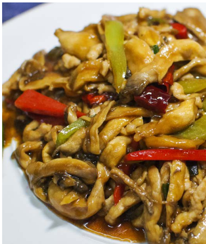
4.13. ЖАРЕНАЯ СВИНИНА С ВЕШЕНКАМИ И ОВОЩАМИ 肉炒平菇