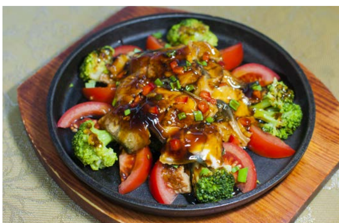
8.14. КОПЧЕНЫЙ УГОРЬ С ОВОЩАМИ