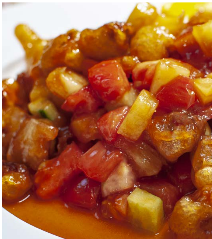
4.5. ЖАРЕНАЯ СВИНИНА В КИСЛО-СЛАДКОМ СОУСЕ С АНАНАСОМ