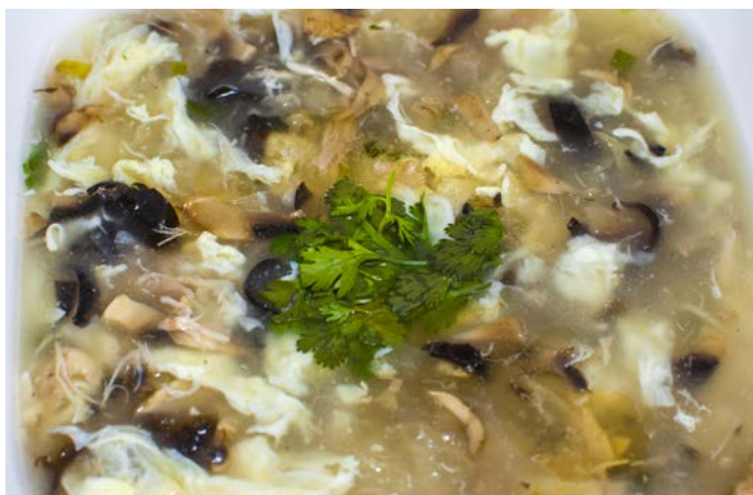
2.7. ГРИБНОЙ СУП С КУРИЦЕЙ 鸡丝蘑菇汤