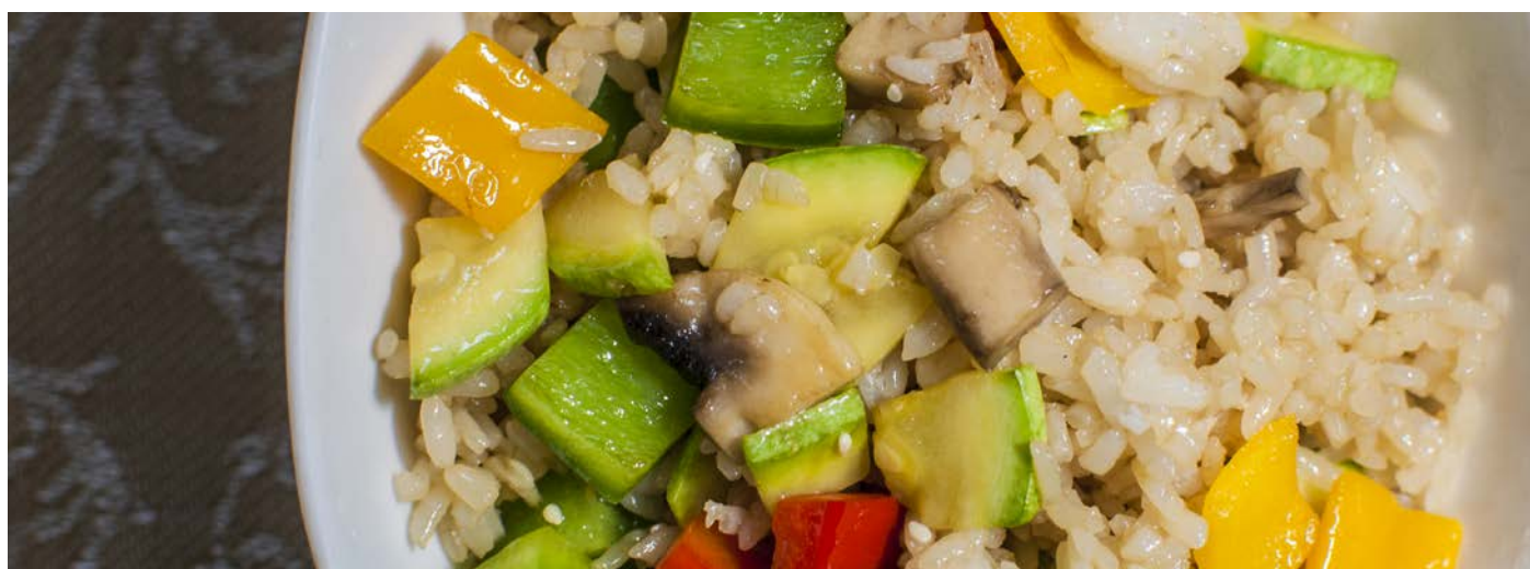
13.7. ЖАРЕНый РИС С ОВОЩАМИ И ГРИБАМИ В СОУСЕ ОТ ШЕФ-ПОВАРА