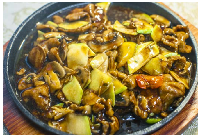
8.8. ФИЛЕ УТКИ В СОЕВОМ СОУСЕ 铁板鸭片