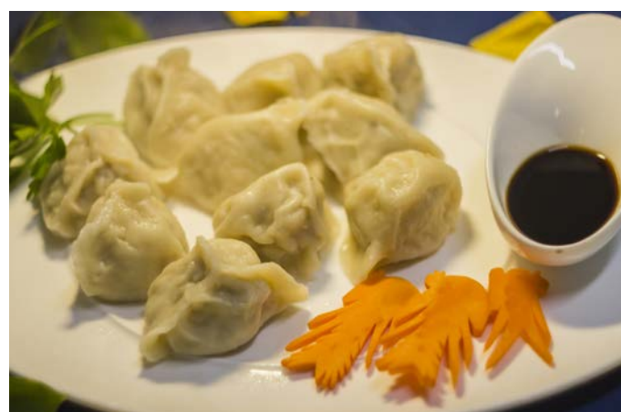
15.6. КИТАЙСКИЕ ПЕЛЬМЕНИ С КРЕВЕТКАМИ И СВИНИНОЙ 三鲜水饺