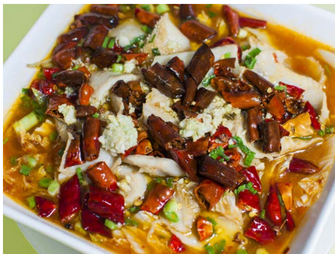
11.4. ГОВЯЖИЙ ЖЕЛУДОК С ТОФУ В ОСТРОМ СОУСЕ 川味干张牛肚