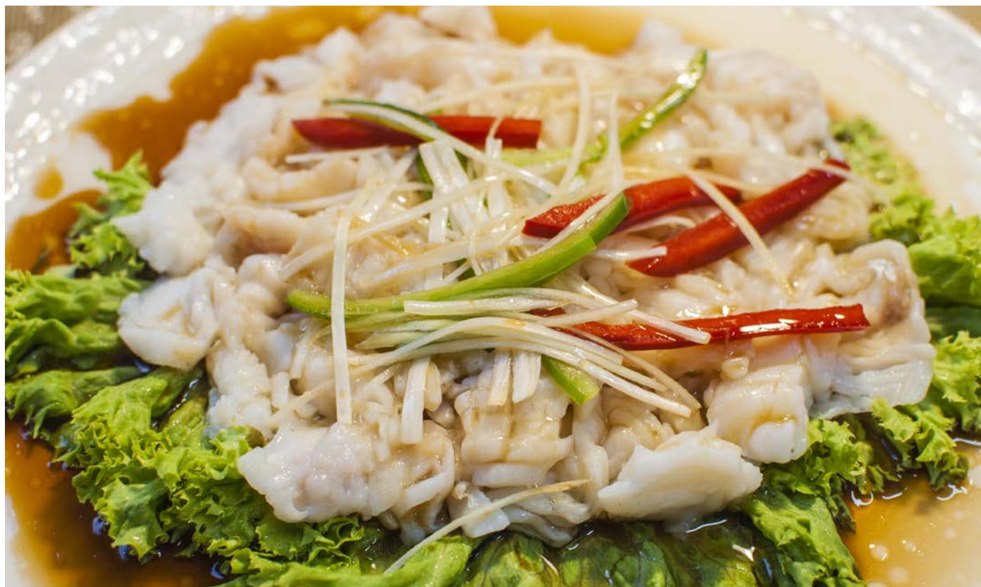
7.18. ФИЛЕ СУДАКА В УСТРИЧНОМ СОУСЕ 豉汁鱼片