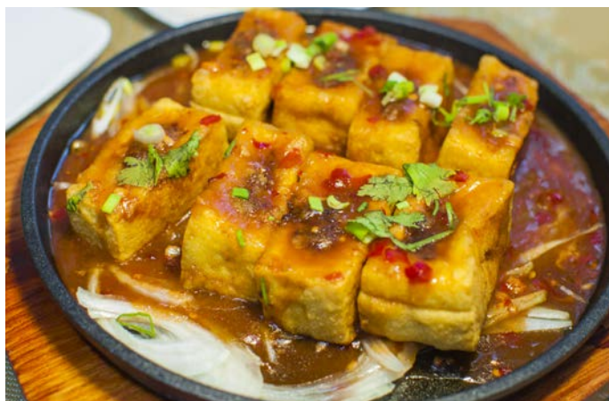
8.11. РУЛЕТКИ ИЗ ТОФУ СО СВИНИНОЙ