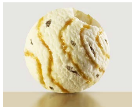
ВАНИЛЬНОЕ С ГРЕЦКИМ ОРЕХОМ И КАРАМЕЛЬЮ 香草核桃味