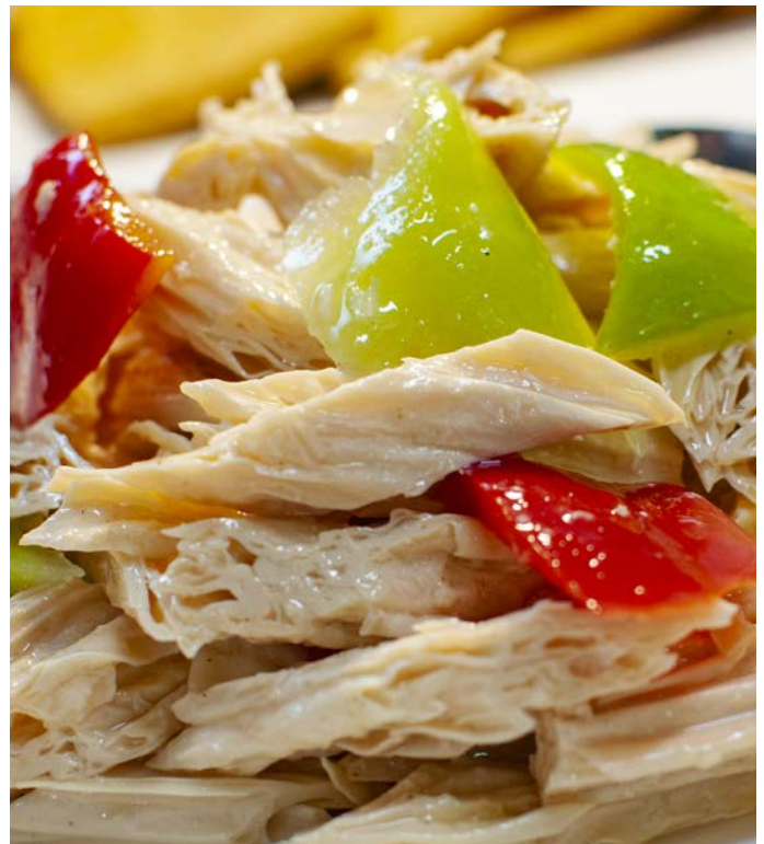
1.5. САЛАТ ИЗ СОЕВОЙ СПАРЖИ С ЗЕЛЕНЬЮ 香伴腐竹