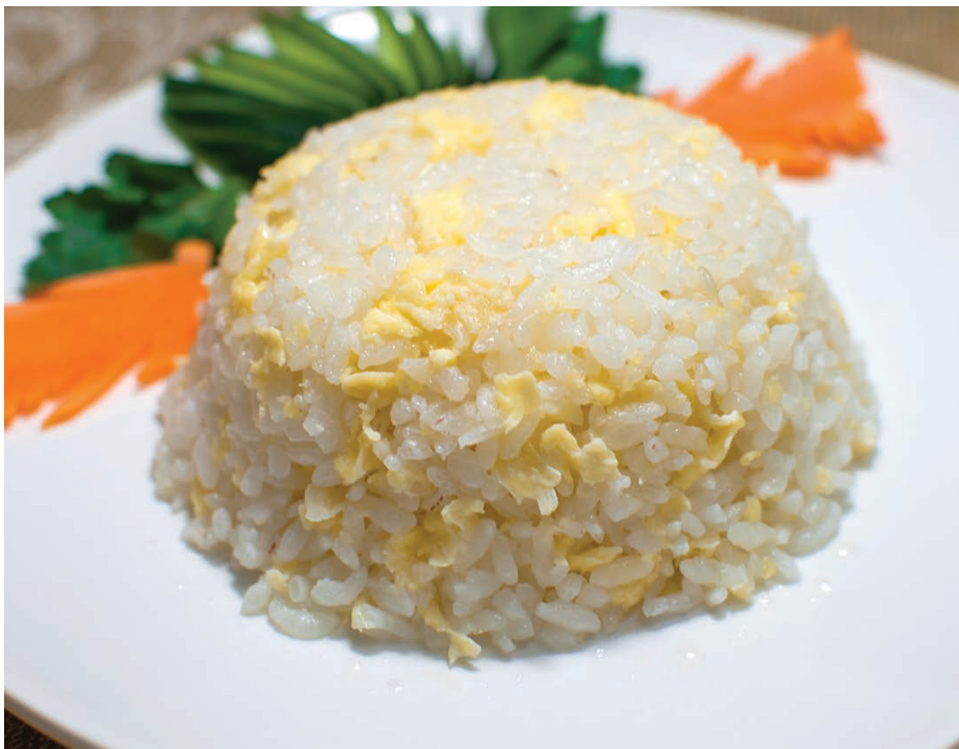
13.2. ЖАРЕНый РИС С ЯЙЦОМ 蛋炒饭