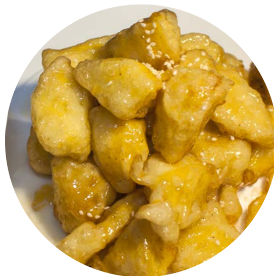
16.2. ЯБЛОКИ В КАРАМЕЛИ