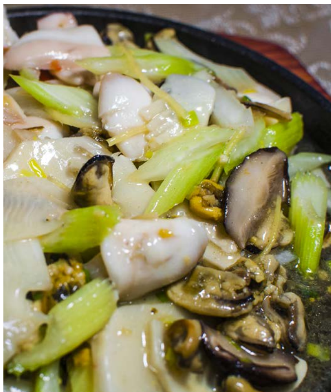
8.5. МОРЕПРОДУКТЫ 铁板海鲜