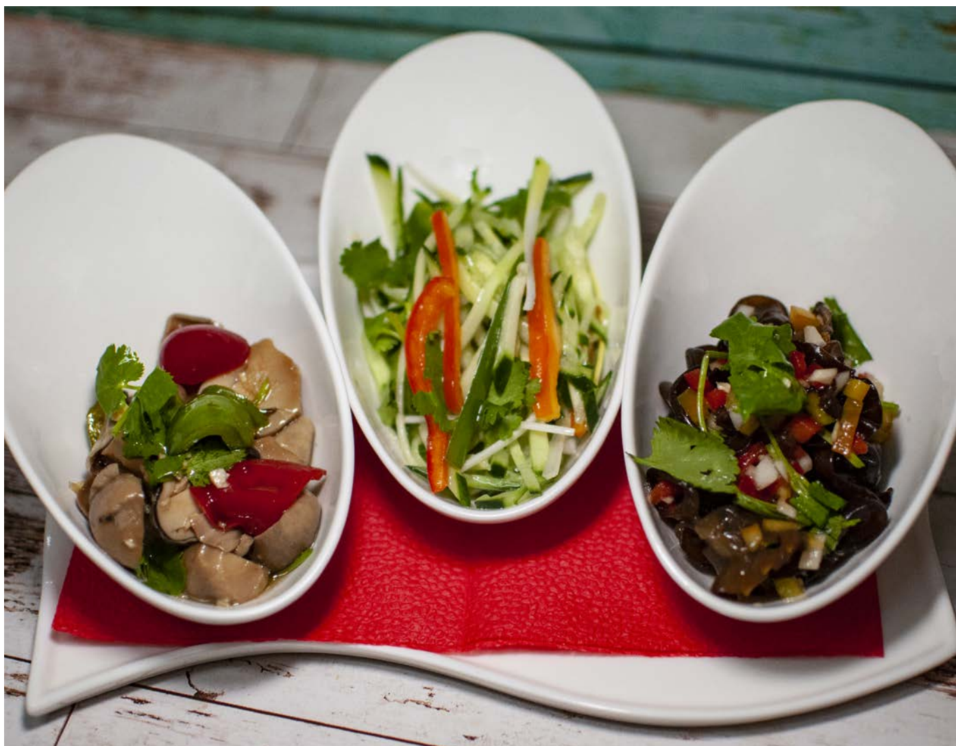
1.26. ГРИБНОЕ АССОРТИ (САЛАТ ИЗ ГРИБОВ МУЭР С БОЛГАРСКИМ ПЕРЦЕМ, САЛАТ ИЗ КИТАЙСКИХ ТРАВЯНЫХ ГРИБОВ, САЛАТ ИЗ ГРИБОВ «ЗОЛОТЫЕ НИТИ»)