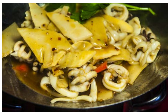
12.5. КАРАКАТИЦЫ 干锅墨鱼仔