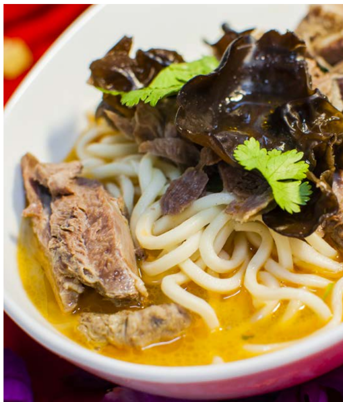
14.8. ЛАПША С БАРАНИНОЙ В ОСТРОМ БУЛЬОНЕ 香辣羊肉汤面