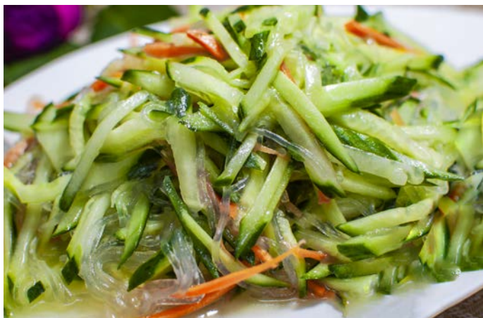
1.18. САЛАТ ИЗ ПРОЗРАЧНОЙ ЛАПШИ С ОВОЩАМИ 黄瓜拌粉丝