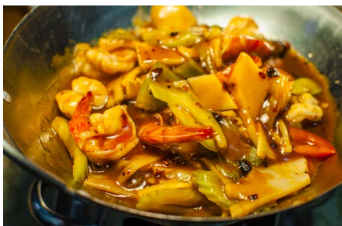
12.4. КОРОЛЕВСКИЕ КРЕВЕТКИ 干锅大虾