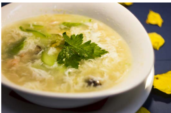
2.6. СУП ИЗ МОРЕПРОДУКТОВ 海鲜汤