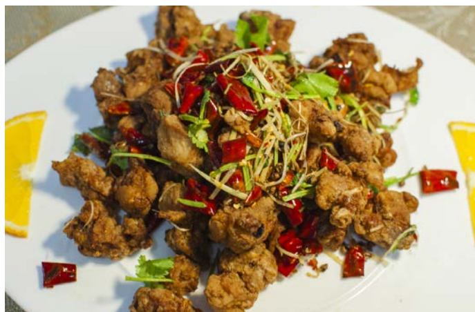
11.5. ХРУСТЯЩИЕ КУСОЧКИ КУРИЦЫ С ПЕРЦЕМ ЧИЛИ (НА КОСТОЧКАХ) 200 г 467₽ 老四川干煸鸡块