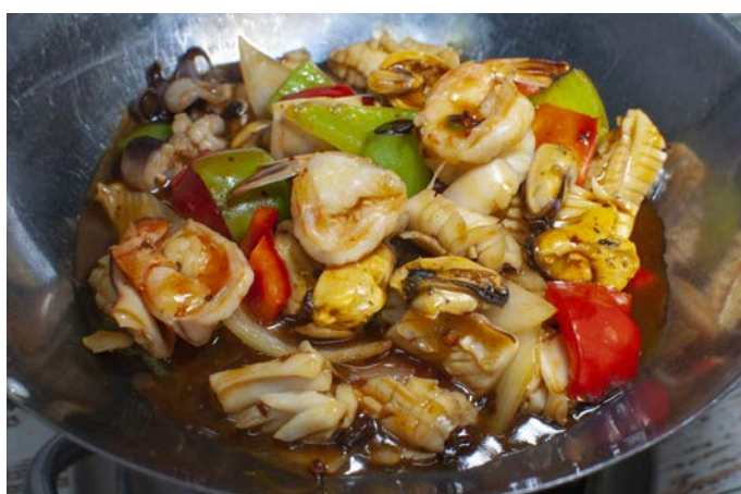
12.7. МОРЕПРОДУКТЫ 铁板海鲜