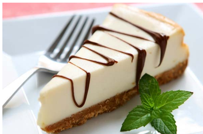
ЧИЗКЕЙК НЬЮ-ЙОРК 纽约芝士