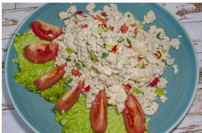
9.3. ОМЛЕТ ИЗ ТОФУ С ОВОЩАМИ