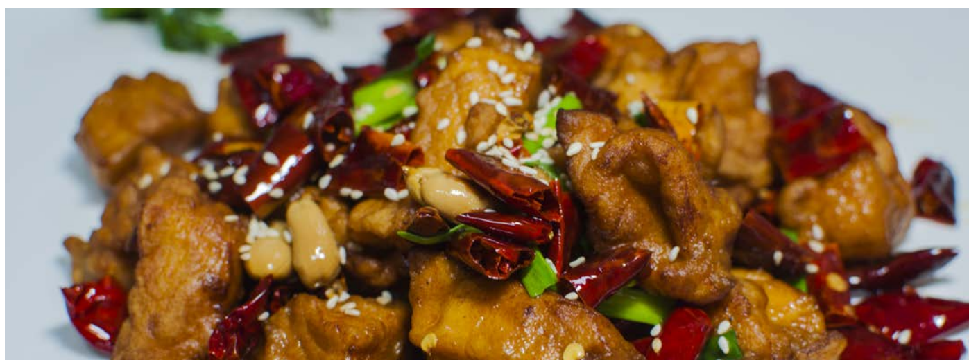
11.7. ЖАРЕНЫЙ ЛОСОСЬ С ПЕРЦЕМ ЧИЛИ 辣炒三文鱼