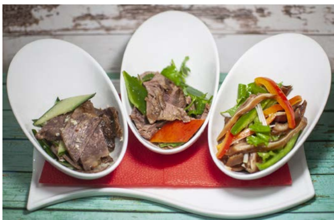
1.27. МЯСНАЯ ТАРЕЛКА (ГОВЯДИНЫ, СВИНОЙ ЯЗЫК, СВИНЫЕ УШКИ)