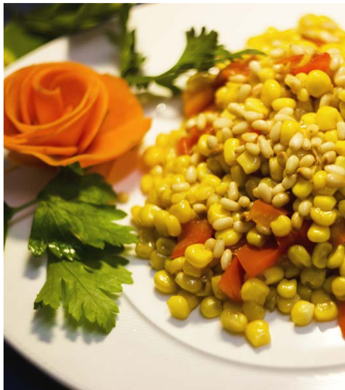
3.9. ЖАРЕНАЯ КУКУРУЗА С ОВОЩАМИ И КЕДРОВЫМИ ОРЕШКАМИ 松子玉米