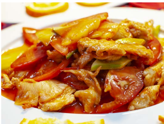
5.6. ЖАРЕНОЕ КУРИНОЕ ФИЛЕ В КИСЛО-СЛАДКОМ СОУСЕ С ТОМАТАМИ, ОГУРЦОМ И АНАНАСОМ