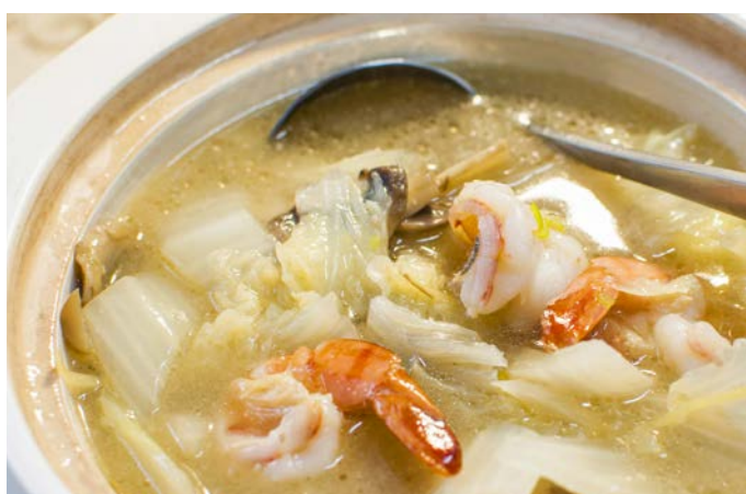
10.7. КРЕВЕТКИ С ОВОЩАМИ И ГРИБАМИ