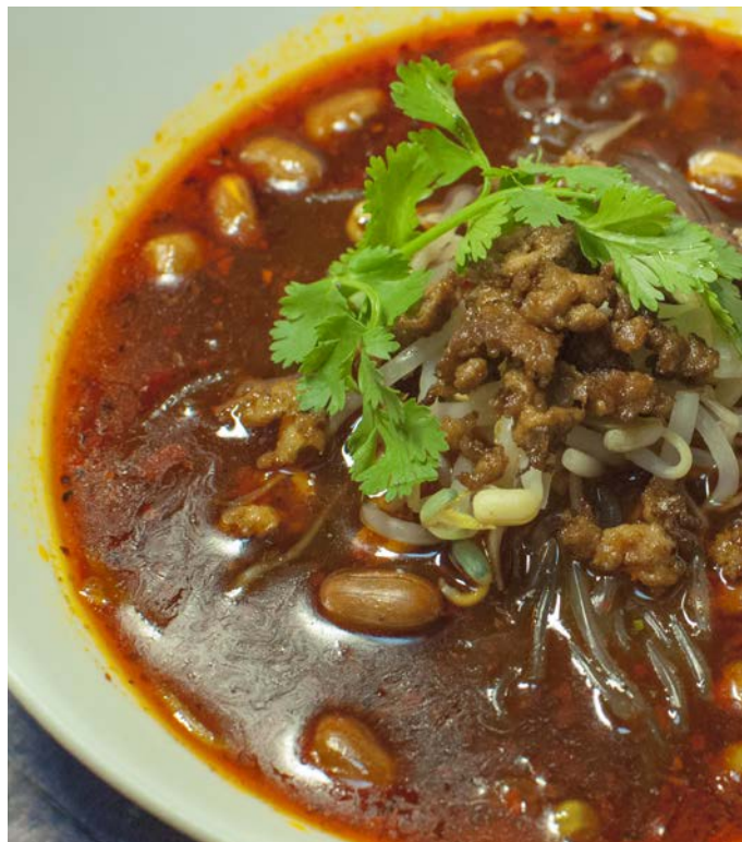
14.13. КИСЛО-ОСТРАЯ ПРОЗРАЧНАЯ ЛАПША СО СВИНИНОЙ В БУЛЬОНЕ