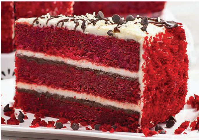
ТОРТ «РЕД ВЕЛВЕТ» 红色天鹅绒