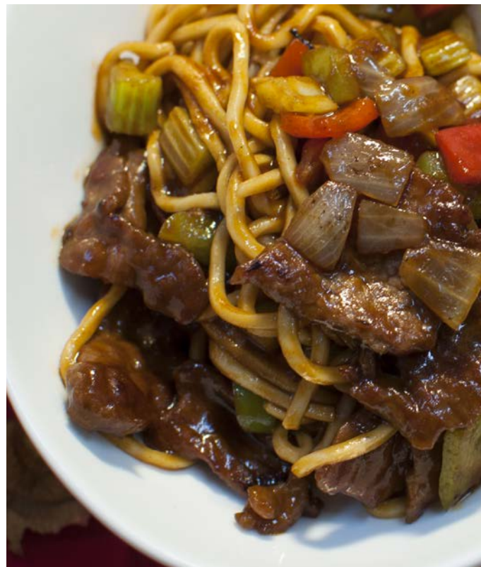
14.9. ЛАПША С ГОВЯДИНОЙ В КИСЛО-СЛАДКОМ СОУСЕ 番茄牛肉炒面