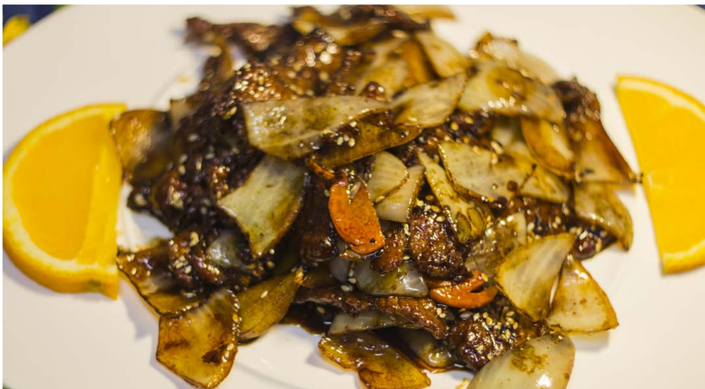
6.7. ЖАРЕНОЕ ФИЛЕ БАРАНИНЫ С ЛУКОМ 葱爆羊肉