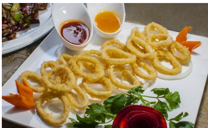
7.6. КОЛЬЦА КАЛЬМАРОВ, ПОДАЮТСЯ С АПЕЛЬСИНОВЫМ И КИСЛО-СЛАДКИМ СОУСОМ