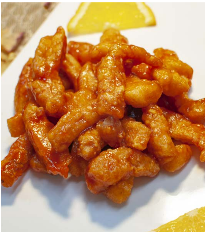
7.13. ФИЛЕ СУДАКА В КИСЛО-СЛАДКОМ СОУСЕ