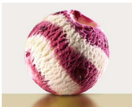
ЧЕРНАЯ И БЕЛАЯ ВИШНЯ 双色樱桃味